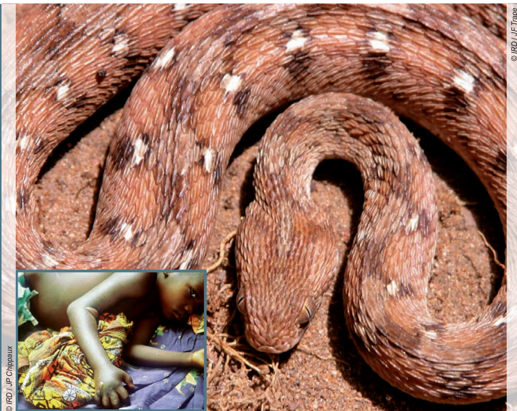
L'échide ocellée est le serpent le plus meurtrier d'Afrique, car elle est la plus répandue dans les savanes. Sa morsure peut provoquer un œdème et des cloques, comme chez cet enfant, et des hémorragies, voire des nécroses.

Un million et demi : c'est le nombre de victimes d'envenimation suite à une morsure de serpent chaque année en Afrique sub-saharienne. Un chercheur de l'IRD vient d'analyser une centaine d'études et rapports médicaux publiés ces quarante dernières années. Jusque là, aucun examen à grande échelle de la situation n'avait été réalisé et les autorités sanitaires sous-estimaient l'ampleur du problème. Ainsi, aujourd'hui, seules 10 % des victimes sont soignées du fait d'un manque d'antivenins* et d'un personnel médical non sensibilisé. Pourtant, les complications cliniques peuvent être très graves, voire fatales. Une morsure de cobra ou de mamba peut conduire à la mort par asphyxie – due à une paralysie respiratoire – dans les six heures suivant l'accident. Celle de l'échide ocellée, une vipère très répandue dans les savanes africaines, peut quant à elle provoquer des hémorragies entraînant le décès en quelques jours. Cette nouvelle étude offre aux autorités des chiffres plus précis et fiables, leur permettant de réajuster leur dispositif de soins au plus près des besoins.