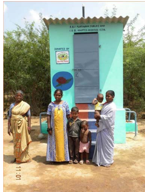
Members of the Family