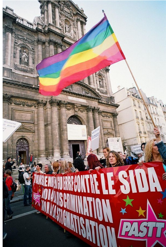
Manifestation contre la transphobie à Paris en France, 1 er octobre 2005.

La transphobie est l'aversion envers le transsexualisme ou la transidentité et envers les personnes transsexuelles ou transgenres relativement à leur identité de genre.