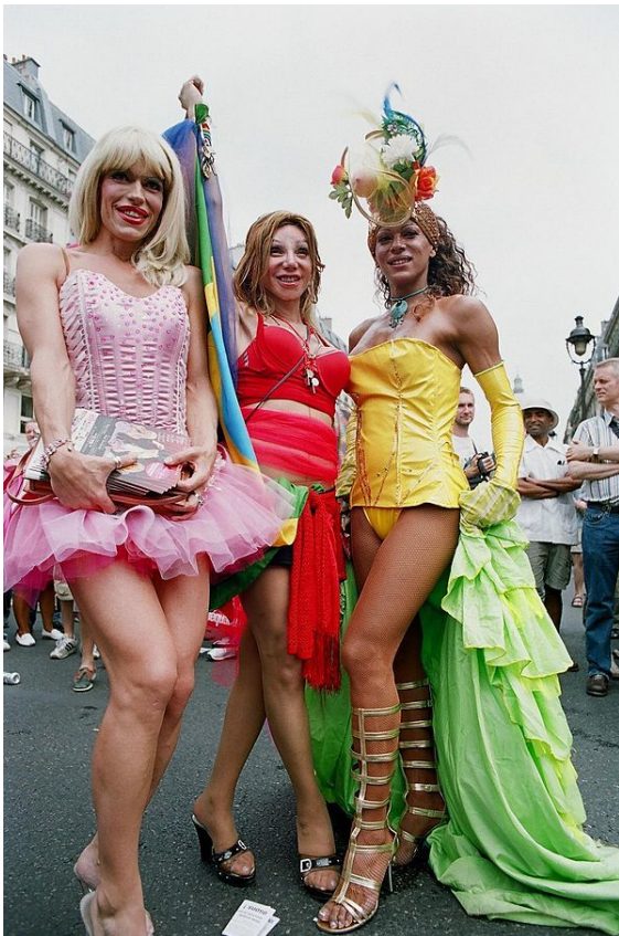
Des militants des Transgenres à la Marche des fiertés de Paris en France, juin 2005.

précaire, invisibles, vulnérables, les travailleurs du sexe contre leur volonté, leur vulnérabilité en fait des cibles faciles pour les actes de violence. Cela est particulièrement vrai dans les prisons [9] .