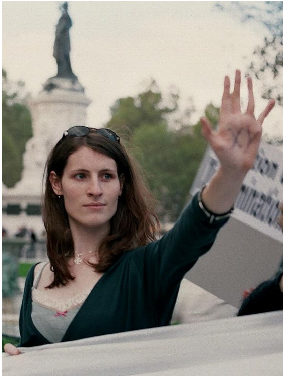
Militante transsexuelle à une manifestation contre la transphobie à Paris en France, 1 er octobre 2005.