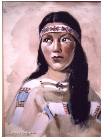
Œuvres de Paul Coze