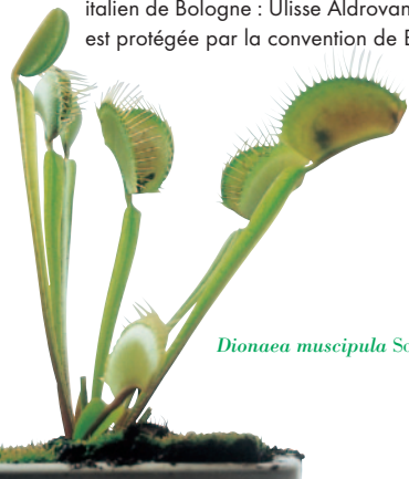
Dionaea muscipula Soland. ex Ellis

Historique : La plante fut observée pour la première fois en Inde au XVI e siècle. Elle est tout d'abord appelée Lenticula palustris indica par L. Plukenet en 1696. En 1747, le botaniste italien G. Monti la baptisa Aldrovandia vesiculosa en l'honneur du naturaliste italien de Bologne : Ulisse Aldrovandi. Cette plante est protégée par la convention de Berne.