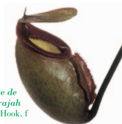
Jeune piège de Nepenthes rajah Hook. f

Historique : Cette plante rare a été décrite pour la première fois en 1859. Le nom d'espèce de rajah vient de l'hindou, qui signifie empereur, car c'est l'une des plus grandes espèces de Népenthès. Cette plante est menacée par les activités humaines et en particulier par les collectionneurs. Elle est en voie de disparition, inscrite en annexe I de la CITES et sur la liste rouge de l'UICN avec la cotation « V » (vulnérable) pour la Malaisie.