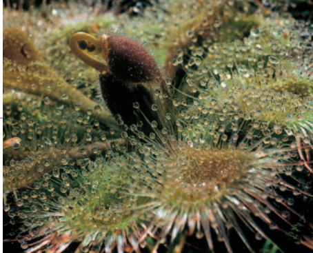
Drosera burmannii Vahl