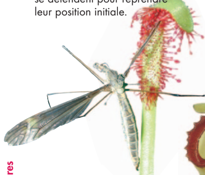
Drosera capensis L.

L'ensemble du processus peut durer 1 minute à plusieurs heures. Par la suite, les tentacules se détendent pour reprendre leur position initiale.