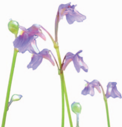
Fleurs d'Utricularia dichotoma Labill.

Historique : La plante a été décrite en 1760 par Jacquin. Le nom d'espèce alpina , du latin alpinus , doit être pris au sens de montagnard car la plante ne vit pas dans les Alpes.