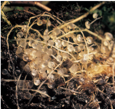
Utricularia humboldtii Schomb

Ces pièges sont les plus sophistiqués du monde des plantes carnivores.