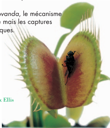
Dionaea muscipula Soland. ex Ellis

Chez Aldrovanda , le mécanisme est similaire mais les captures sont aquatiques.