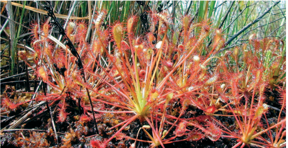
Drosera intermedia Hayne

Pour ces raisons, on admet généralement le terme de « plantes carnivores » qui englobe toutes les plantes qui attirent, capturent et digèrent des proies, quelle que soit la nature de celles-ci.