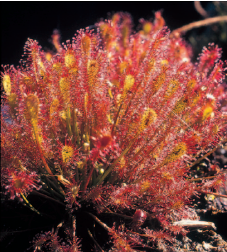
Drosera x beleziana E.G. Camus

Fondée en 1948, l'Union Internationale pour la Conservation de la Nature rassemble des Etats, des Organismes Gouvernementaux et de nombreuses Organisations Non Gouvernementales (plus de 980 membres en tout, répartis dans environ 140 pays). L' UICN cherche à influencer, à encourager et à aider les sociétés dans le monde entier pour conserver l'intégrité et la diversité de la nature et à s'assurer que toute utilisation des ressources naturelles est équitable et écologiquement durable.