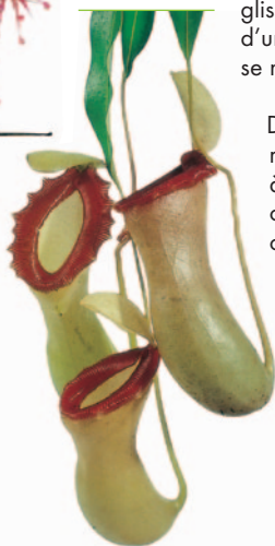
Nepenthes ventricosa Blanco