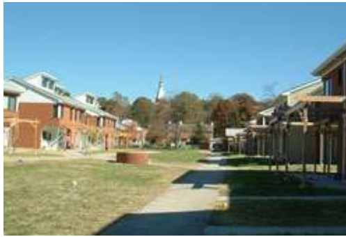
Ecovillage de l'Université de Berea, au Kentucky, aux USA.