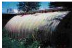
Serres pour les productions d'hiver (avec utilisation de compost produit sur place).

Une partie du terrain agricole serait consacré à :