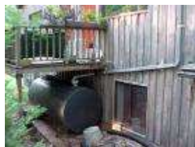
Dans un écovillage, tout est recyclé ou (ré)utilisé, y compris l'eau de pluie.

L'eau du village serait réutilisée et recyclée. Les toits récoltent l'eau de pluie dans les citernes.