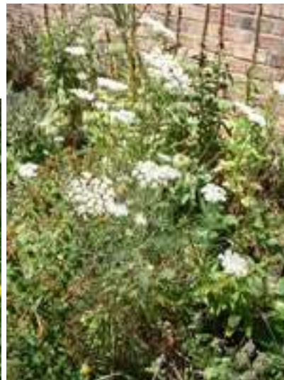
Exemples de jardins naturels.