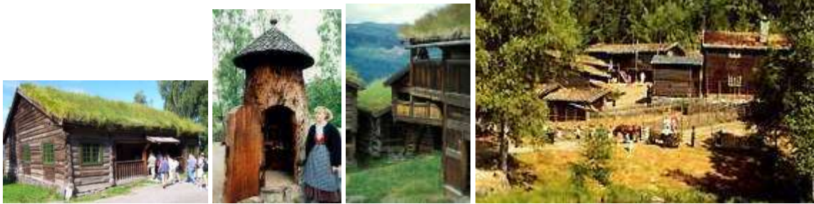
Maisons à toit végétalisée et « maison de Troll », Ecomusée de Maihaugen, Lillerhammer (Norvège).

La diversité architecturale des bungalows pourraient s'inspirer de la diversité des maisons préservée au très bel écomusée Maihaugen de Lillerhammer en Norvège. Un bon nombre de ces maisons auraient un toit supportant une couverture végétale comme certaines maisons islandaises et norvégiennes (sous la terre arable du toit, se trouve un toit rendu étanche par du bitume).