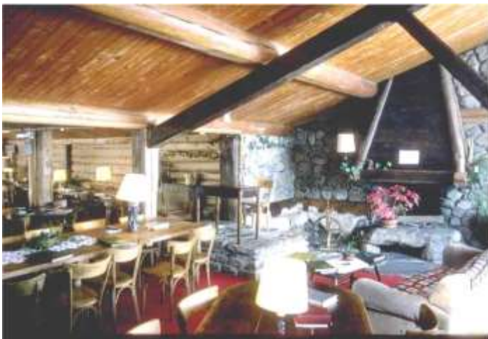
salle à manger à la Flatière