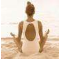
Moment de repos et de relaxation.

Bilan (questionnaire de satisfaction et souhaits futurs de la part de clients désirant d'autres stages).