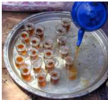
Le temps du thé.