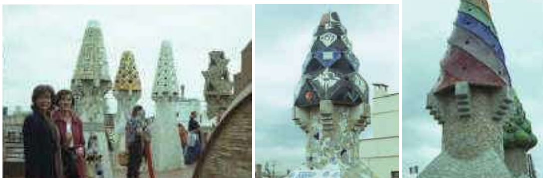
Cheminées du Palau Güell d'Antoni Gaudí à Barcelone

On pourrait encore imaginer des cheminées originales, torsadées, comme celles de Gaudi.