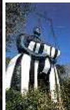
Vues sur le Jardin du Tarot de Niki de Saint-Phalle en Toscane.

Même les toilettes seraient originales et imaginatives (en fait, tout le serait dans l'écovillage).