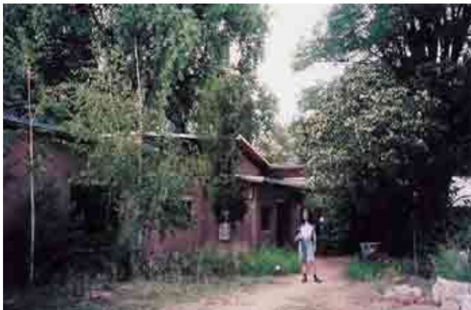
Eco-village en Inde, avec environnement intégré.