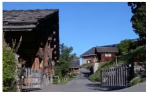
Entrée de la Flatière