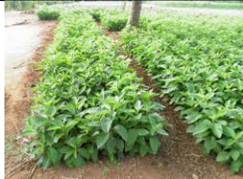
76. Champ d'amarantes (?)