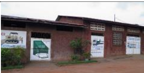
1. Atelier de mécanique, encore fermé, situé à gauche du grand portail d'entrée.

Note : Les n° des photos se reportent aux n° indiqués dans le texte de cette visite, que vous pouvez télécharger en cliquant sur ce lien : http://benjamin.lisan.free.fr/developpementdurable/Visite-au-centre-Songhaï-de-Porto-Novo_Benin.doc