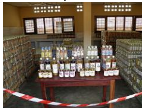
12. entrepôt de stockage des jus de fruits, des sirops et des confitures.