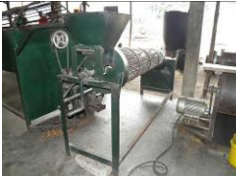
59. Traitement des noix de palmiers a huile