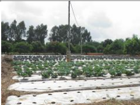
77. Champ de choux