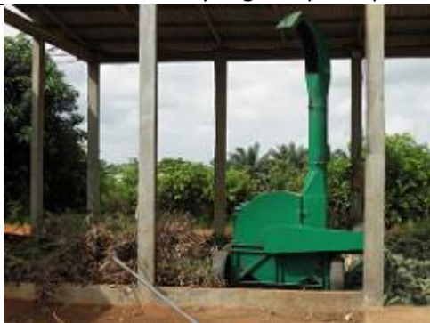
91. déchiqueteuses ou broyeuses électriques à BRF (bois raméal fragmenté).