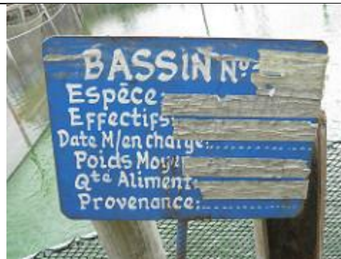
80. Panneau d'un bassin de pisciculture. Il indique « Tilapia ».