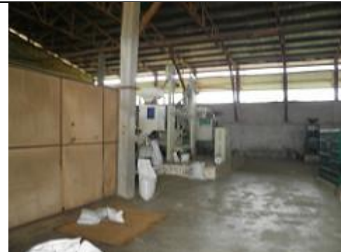
60. Hangar où sont conditionnés, en grands sacs de 50 kg, diverses variétés de riz produit par Songhaï, en particulier du riz étuvé