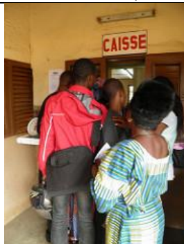
5. Magasin, situé à l'entrée de Songhaï