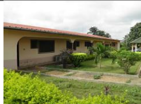
98. annexes hôtelières.