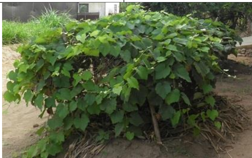
54. une expérimentation de culture de vigne en cours

(ou bien Des jeunes sont en train de transférer le contenu (céréales ?) de grands sacs tissés de 100 kg vers une machine de broyage (?)).