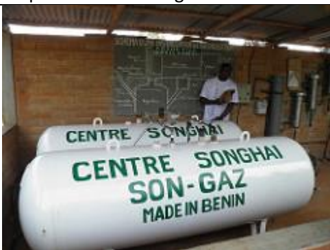
34. Le biogaz produit par le digesteur, puis filtré, est stocké dans deux grands réservoirs