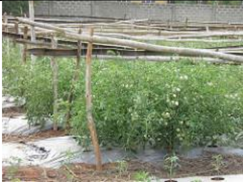
75bis. Plants de tomates.