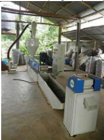
85. Unité de recyclage du plastique