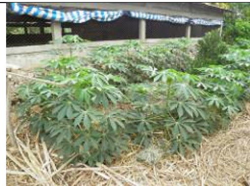
69. Plantation de manioc.