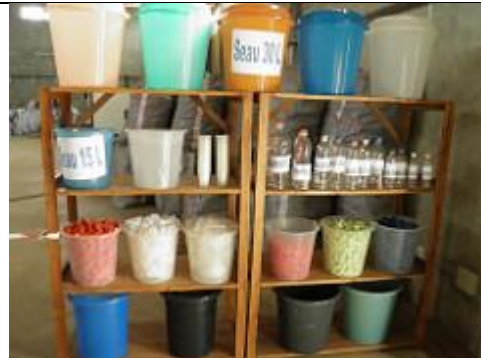
90. Unité de recyclage du plastique