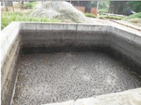
32. Le purin [ou lisier] des porcs est stocké dans une grande fosse. Il servira dans le digesteur de l'unité de production de biogaz situé à côté.