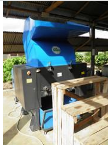
88. Unité de recyclage du plastique