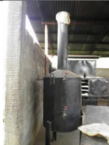
18. Fumoir ou cuve de carbonisation (?).