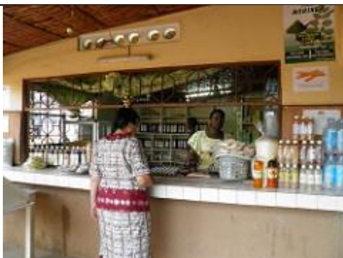
7. Magasin, situé à l'entrée de Songhaï