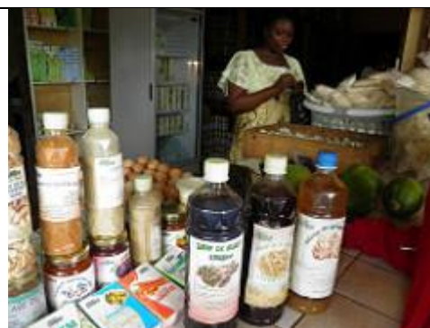
4. Magasin, situé à l'entrée de Songhaï