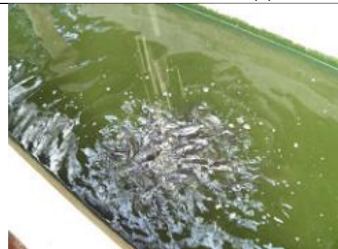
49. Elevage de poissons-chat.