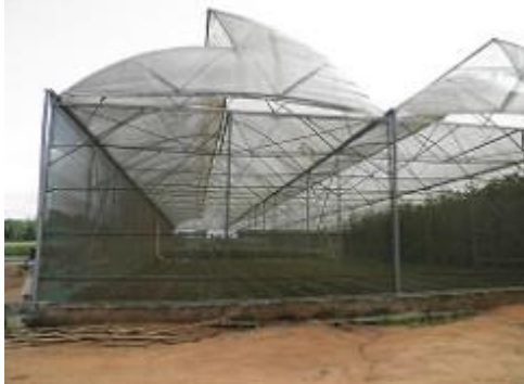
79. Grandes serres, dans les murs sont faits de tissus et le toit de film plastique