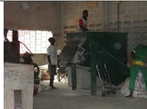
53. Hangar où sont conditionnés des sacs de riz.

(ou bien Des jeunes sont en train de transférer le contenu (céréales ?) de grands sacs tissés de 100 kg vers une machine de broyage (?)).