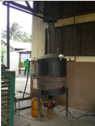
19. Fumoir ou cuve de carbonisation (?).