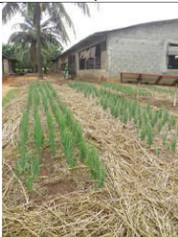
68. Plantation d'oignons