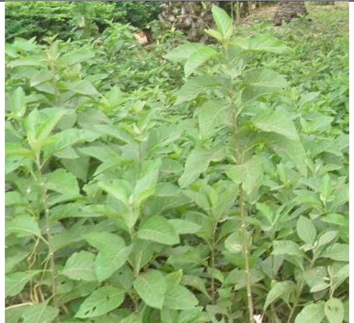
39. Champs de vernonia (?) ou chia (?) ou d'amarantes (?)