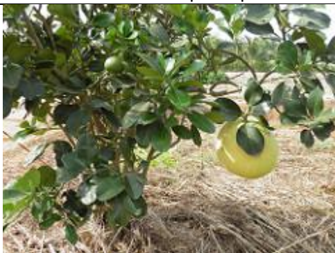
81. Plantation de pamplemousses (pomelo)