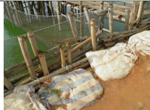
45. Les bassins sont bordés de fascines [faisceaux de branchages croisés], réalisés en grosses tiges de bambous, retenant des sacs de terre et destinés à en renforcer les rives.