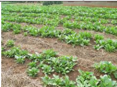
70. Champ de salade (?).