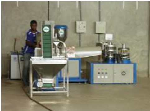
89. Unité de recyclage du plastique