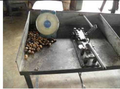
65. Unité de « grillage » et de conditionnement des noix de cajou.