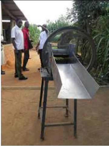
36. Broyeur à jacinthe d'eau.