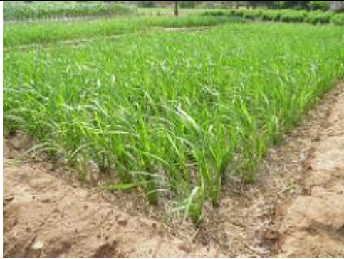
72. Champ de riz, eux aussi paillés.