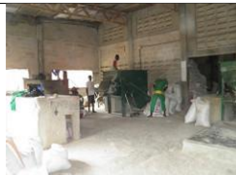
63. Hangar où sont conditionnés des sacs de riz.