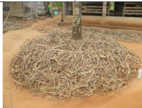
82. Tous les arbres (cocotiers ...) sont entourés d'une épaisse couche de paillis.