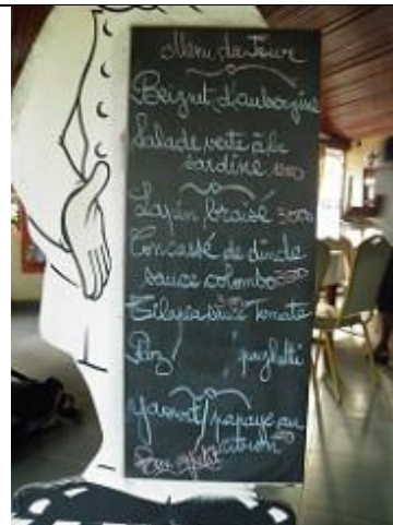
10. Menu du jour du restaurant.

9. Au niveau de la boutique de vente des produits de Songhaï, située à l'entrée du centre, un panneau fléché indique : « Solar show room : Lampes, Sacs, Unités solaires portables, Recharge, Climatiseur, Frigo, Pompes, LED, Batteries, Lampadaires, Kits domestiques, Panneaux, Contrôleur de charge ... » et « Super semences ».