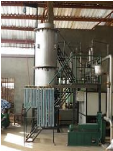
95. Nouvelle unité de production d'électricité par gazéification [pyrolyse ?] de la biomasse (bois ...).