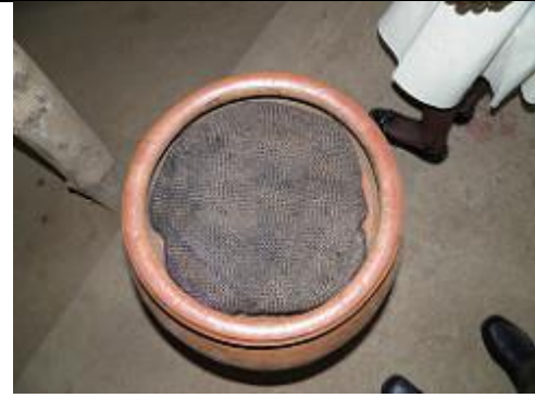
43. Récipient servant de réfrigérateur naturel, recouverts d'un tissu.