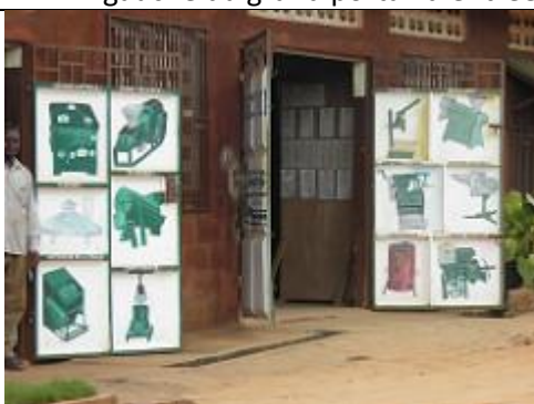
3. Atelier de mécanique, ouvert.