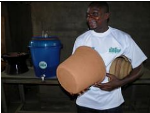
40. Filtre placé dans un récipient ou seau en plastique muni d'un robinet [seau fabriqué à Songhaï à partir de plastique recyclé]. Ce filtre filtrerait 2,5 litres d'eau par heure.