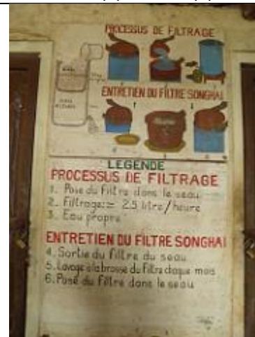
41. Filtre à eau.