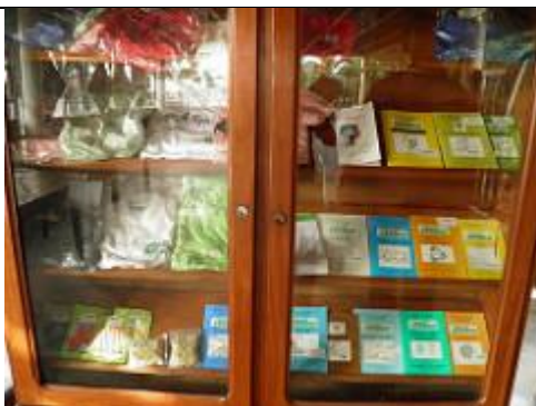
11. Librairie de vente des publications du centre, dont ses guides pratiques.