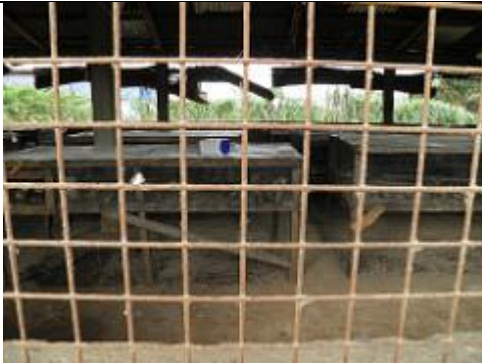
30. Elevage de lapins