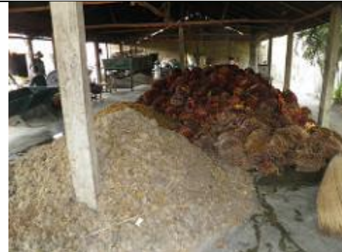
58. Traitement des noix de palmiers a huile