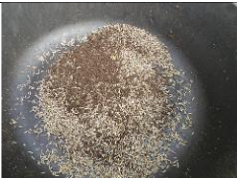
48. Vers à mouche pour nourrir les poissons-chat