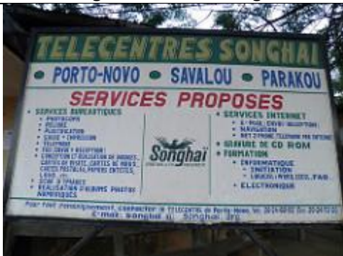
99. Panneau de présentation du télécentre