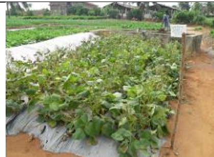
71. Champ de haricot Green-Gramme de Thaïlande