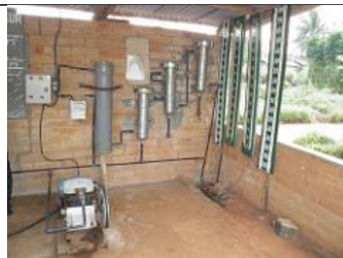
35. Une série de quatre grands manomètres _ de fabrication maison _ sert à mesurer la pression du gaz