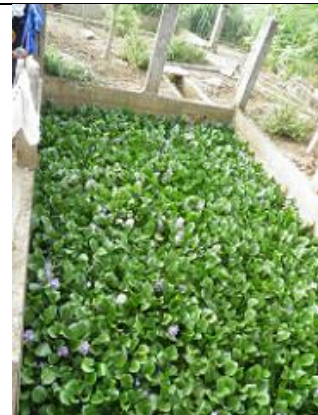
20. Bassin de phyto-épuration par jacinthes d'eau