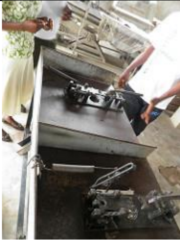
64. Unité de « grillage » et de conditionnement des noix de cajou. Des machines manuelles servent à décortiquer la graine [ou noix] de sa cosse [ou enveloppe].