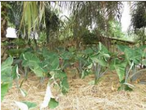
26. Taro à grandes feuilles