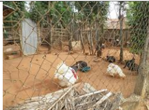
25. Dindons et pintades