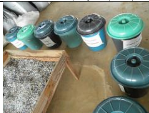
86. Unité de recyclage du plastique