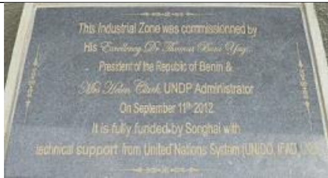
93. Unité de production d'électricité par gazéification [pyrolyse ?] de la biomasse (bois ...). Panneau commémoratif.