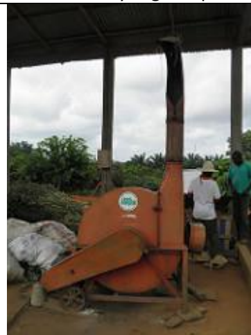
92. déchiqueteuses ou broyeuses électriques à BRF (bois raméal fragmenté).