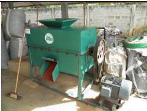
89. Unité de recyclage du plastique