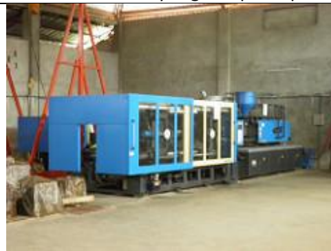
90. Unité de recyclage du plastique