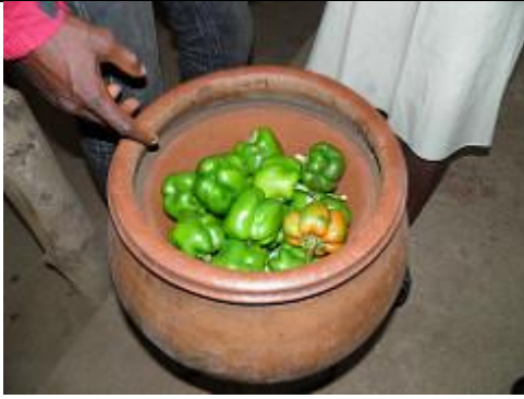
42. Récipient servant de réfrigérateur naturel, constitué d'une céramique conique étanche où est placé l'aliment à réfrigérer, qui s'emboîte dans un récipient en céramique poreuse. L'évaporation de l'eau contenue dans le récipient poreux le refroidit. Pour conserver le froid, les aliments sont recouverts d'un tissu