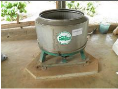
87. Centrifugeuse (Unité de recyclage du plastique)