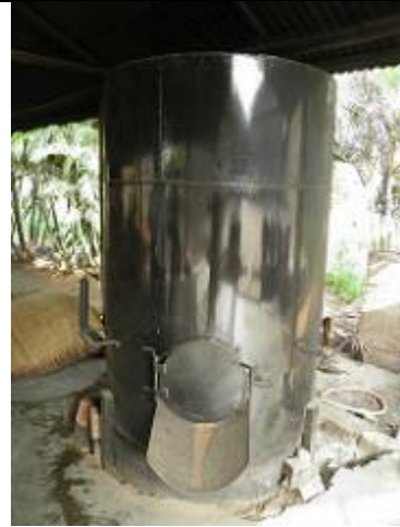
56. Traitement des noix de palmiers a huile