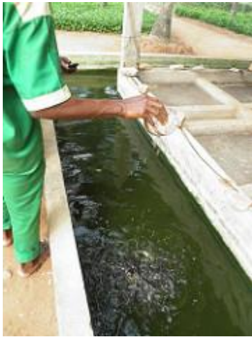
50. Elevage de poissons-chat.