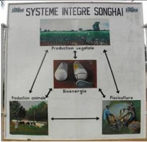
101. Panneau de présentation du système intégré de Songhaï