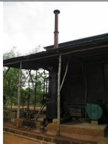
96. Ancienne unité de production d'électricité par gazéification [pyrolyse ?] de la biomasse (bois ...).