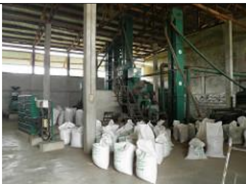
61. Hangar où sont conditionnés des sacs de riz.