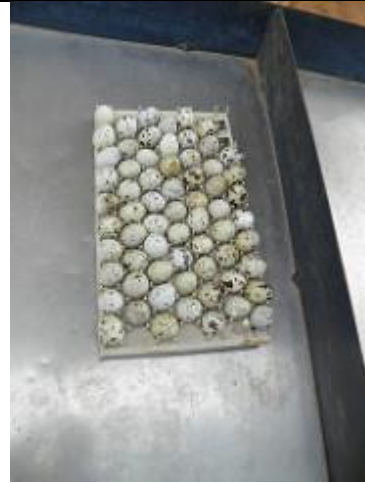
29. œufs de cailles