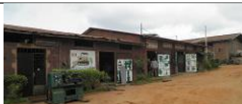
2. Atelier de mécanique, ouvert.