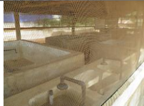
47. Ecloserie à alevins (?).