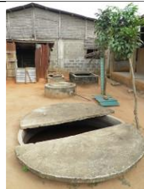
33. Le digesteur d'une dizaine de m3 est situé sous une dalle de béton.