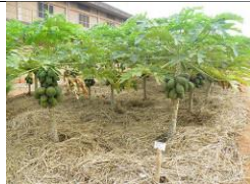
67. Plantations d'une variété de papayers nains.