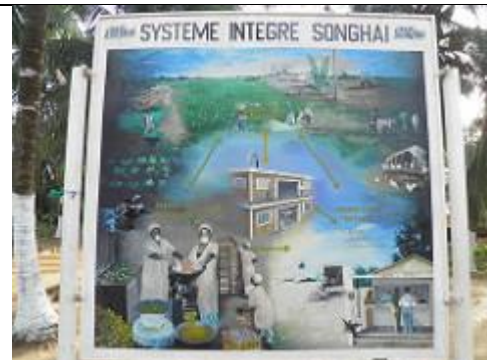
100. Panneau de présentation de Songhaï