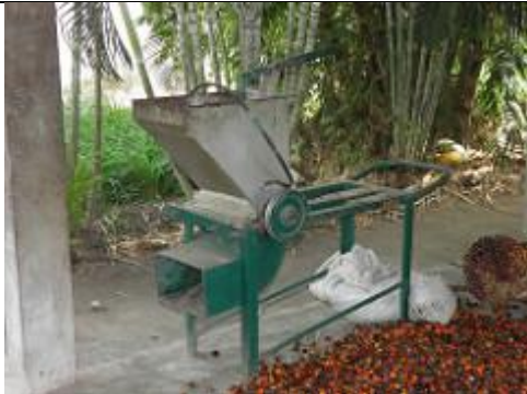
57. Traitement des noix de palmiers a huile