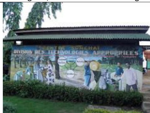
8. Fresque murale, située à l'entrée de Songhaï, du côté de l'atelier mécanique