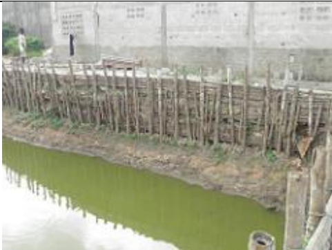
46. Les bassins sont bordés de fascines