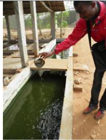
51. Elevage de poissons-chat.