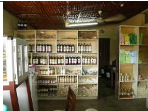
6. Magasin, situé à l'entrée de Songhaï