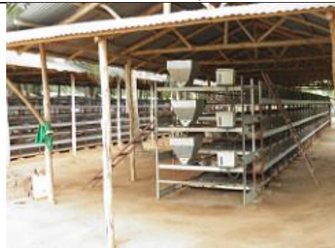
27. Elevage en batterie, entièrement automatisé, de poulets de chair.