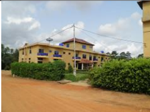
97. grand hôtel de Songhaï