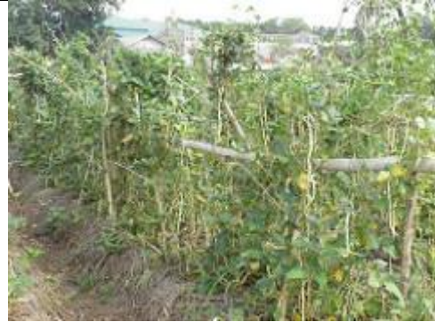
75. Plants de tomates.