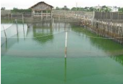
44. Bassin à pisciculture.