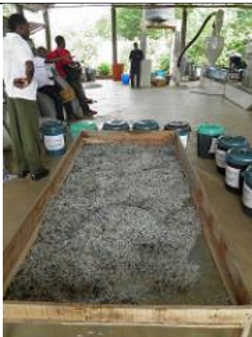
83. Unité de recyclage du plastique