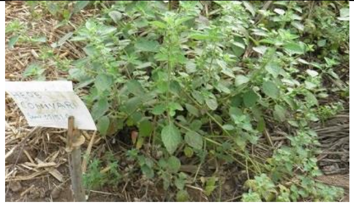
37. Herb conivari.