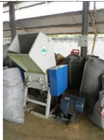
84. Unité de recyclage du plastique