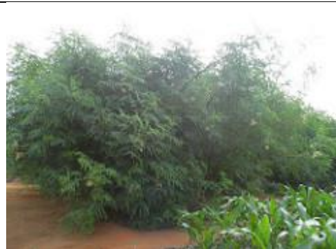
78. plantations de Moringa stenopetala , ou « arbre chou »