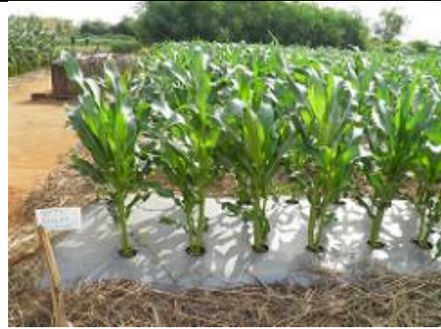
73. Champs de maïs sucrés, le sol au pied de ces maïs étant protégé par du film plastique