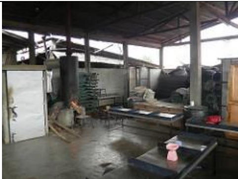
66. Unité de « grillage » et de conditionnement des noix de cajou.