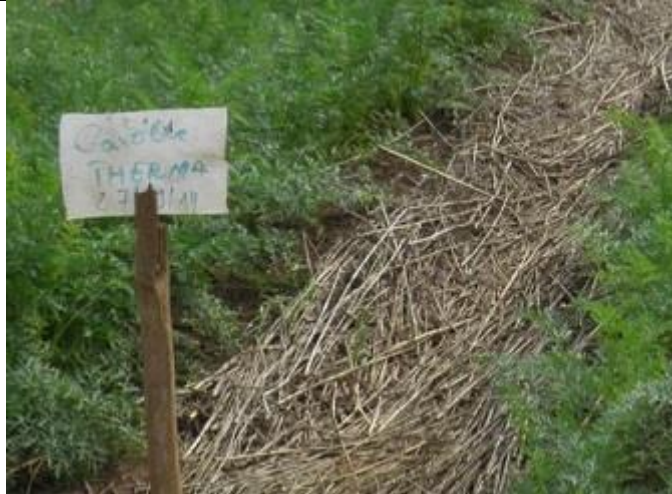
74. Champs de carottes de la variété Therma (?)