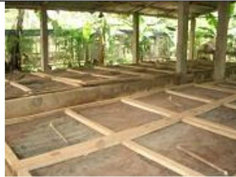
31. Elevage d'escargots