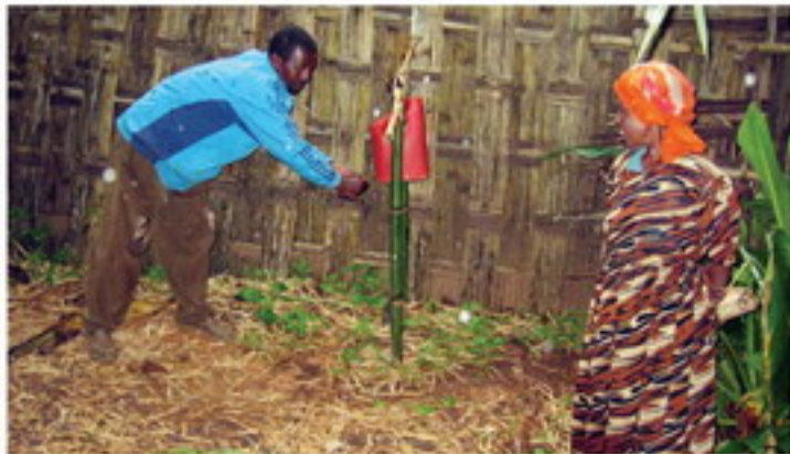
सीने सीने, इतिहासिक रूप से समुदाय में द्वारा एक काम करने वाले में अधिकांश सेना का विकास किया गया, संकेतक संचालित से सिने सेने का प्रयोग सीने को बना दिया गया सिने सेने में काम समुदाय में काम करने का भी.