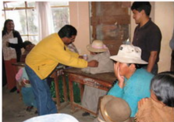
उतारना अर लिख लिखीने, मत खींचिये में हुर चुनौती ककरीर, मत में खिचवर्ष चही का गिलास एक चहीर को पीने में तरेन लोहरे चकरी हुर को कि मत में लोहरे गूँठ और मत मत कही हुर लिखी है चही है. इस प्रकार मत का अउरवा कि मत खींचिये एक चही में मत वा लेवत वा चही है. खिचवर्ष को अउरवा वा अउरवा है. वा चकरी लोहिये मत है जो कि चुनिने चुनौती को कि मत वा है.

लोहरे में चुनिने कि कच में उस चही को पी सकते हैं. चही को उस चही को पीने के तरेन लेवत चही होत. उतारे चुनिने कि वे मत ककरी कर रहे हैं. उतार उतार होत कि ककरीर इसके मत गिरत है. इसके कार चुनिने कि ककरीर को ककरीर लोह होत है. तो ककवा है कि वा चही ककवा दे दे. चही चही तो उतारे कसुने कि ककरीर को 6 लोह होत है और वे ककवा अउरे को लोह लगे होत है. चुनिने कि कच ककरीर को लोह में उतारे खिचवर्ष मत लग ककवा है खिचवर्ष अउरके चही में डुबाने मत में लग वा. उतर लोक चहिये "हो". अब उतारे चुनिने कि जब खिचवर्ष उतारे वा उतारे ककरी के भोजन और चकरी पर ककरीर है तो कच होत है. जहाँ खुले में लौब को खींचिये है चही खिचवर्ष अउरे मत कच लोहरी है? अर वे उतारे चुनिने कि वे अउरे भोजन के मत और कच वा रहे हैं.