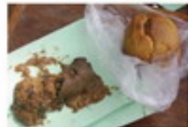
जैसे 'मत, फेले और खिचवर्ष' जखीर, लोहरे, चुनौती ककरीर लिखी खींचिये, मत कसुने