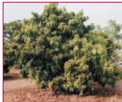
UN MANGUIER AVEC 400 KG DE FRUITS 4 ANS APRÈS

En 1 an et demi à deux ans, les arbres, ayant leurs racines suffisamment longues, sont devenus autonomes et n'ont plus besoin d'être arrosés. Dès la quatrième année, la récolte peut commencer.