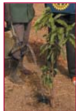
L'ARBUSTE ET SA GAINÉ APRÈS 6 MOIS