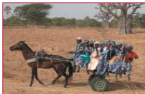
UN GROUPE DE PAYSANNES SE RENDANT AUX PLANTATIONS

Tous les dons pour Reverdir le Sahel ou les bénéficiaires d'actions faites par les Rotary-Clubs vont entièrement et sans retenue d'aucune sorte aux villages concernés sous forme de plants d'arbres munis chacun de leur gaine.