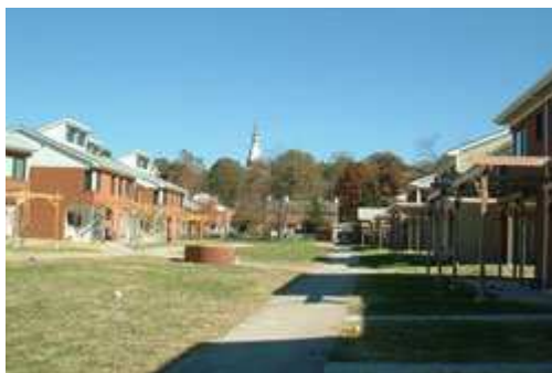
Ecovillage de l'Université de Berea, au Kentucky, aux USA.