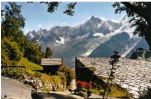
Entrée de la Flatière

L'endroit, que par ses jardins ou son architecture, son site doivent être très jolis, remarquables, comme l'écovillage de Végan, ou le centre de retraite catholique de la Flatière (situé à côté des Houches).