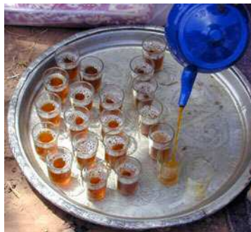
Le temps du thé.