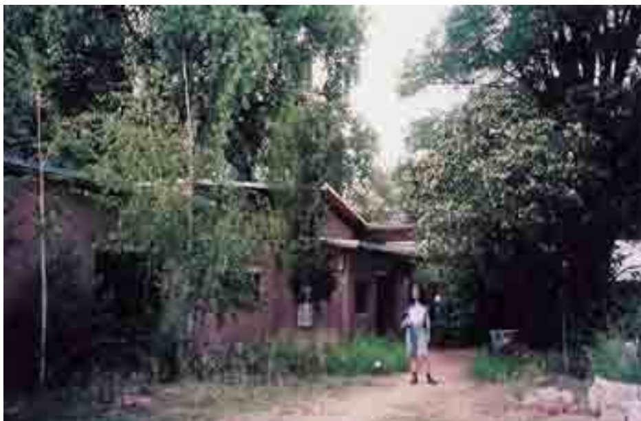
Eco-village en Inde, avec environnement intégré.