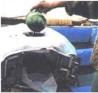
Récolte de spiruline