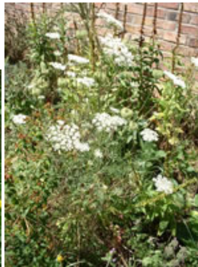
Exemples de jardins naturels.