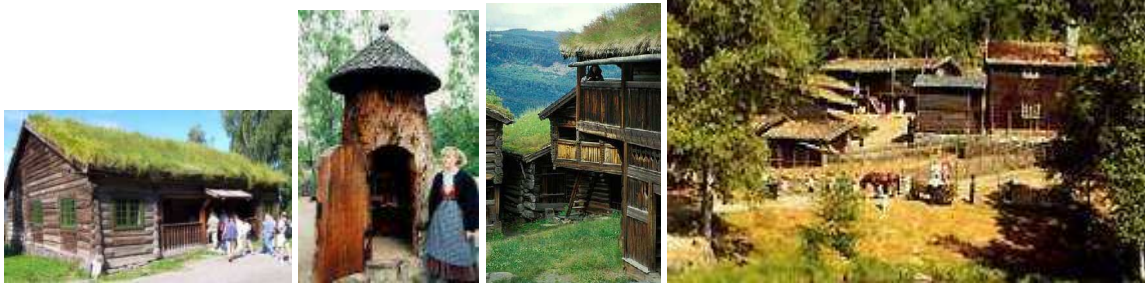
Maisons à toit végétalisée et « maison de Troll », Ecomusée de Maihaugen, Lillerhammer (Norvège).

. un lieu pour des universités d'été et universités populaires (cours d'initiation et d'apprentissage à la culture universelle humaniste, à la culture scientifique, cours de culture générale ...), . un lieu de stages (stages de ressourcement, culturels ..., y compris stages astronomiques, botaniques, mathématiques ...), avec des places d'hébergement, d'abord dans le gîte, la ferme, puis plus tard dans des bungalows comme au centre de la Flatière (à côté des Houches et de Chamonix). La diversité architecturale des bungalows pourraient s'inspirer de la diversité des maisons préservée au très bel écomusée Maihaugen de Lillerhammer en Norvège. Un bon nombre de ces maisons auraient un toit supportant une couverture végétale comme certaines maisons islandaises et norvégiennes (sous la terre arable du toit, se trouve un toit rendu étanche par du bitume).