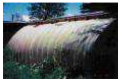
Serres pour les productions d'hiver (avec utilisation de compost produit sur place).

Une partie du terrain agricole serait consacré à :