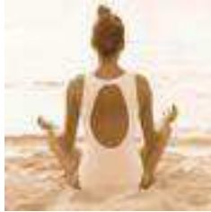
Moment de repos et de relaxation.

Bilan (questionnaire de satisfaction et souhaits futurs de la part de clients désirant d'autres stages).