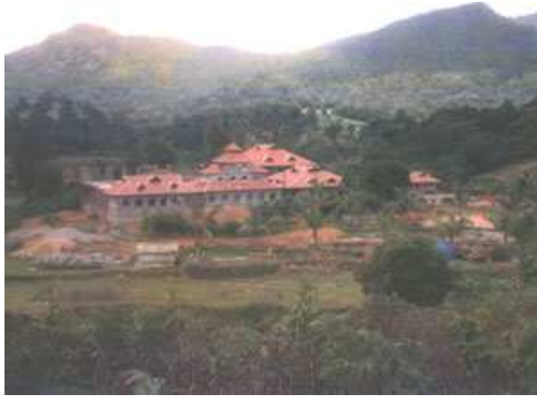
Ecovillage de Soan, en Inde.