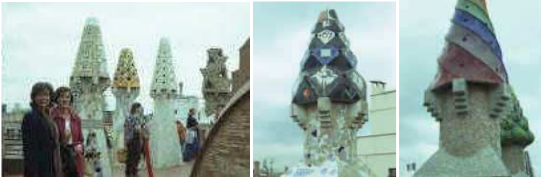
Cheminées du Palau Güell d'Antoni Gaudí à Barcelone

On pourrait encore imaginer des cheminées originales, torsadées, comme celles de Gaudi.