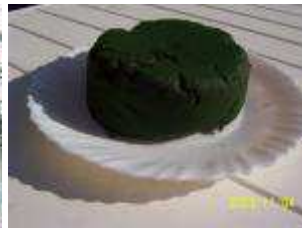
et spiruline récoltée.