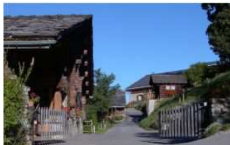
Entrée de la Flatière