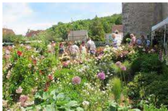
Jour du « Festival de la rose » qui a lieu, chaque année, à Chédigny.