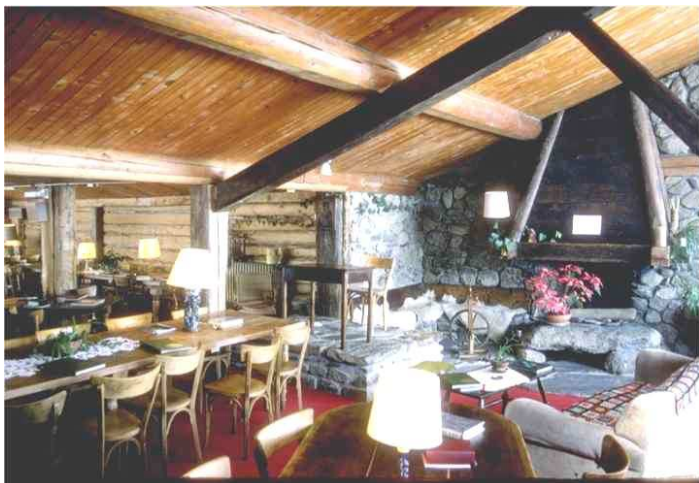
salle à manger à la Flatière