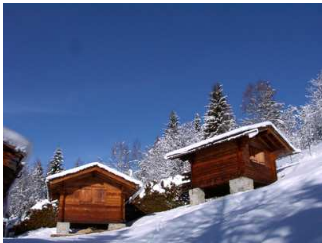
Bungalows pour accueillir les retraitants à la Flatière