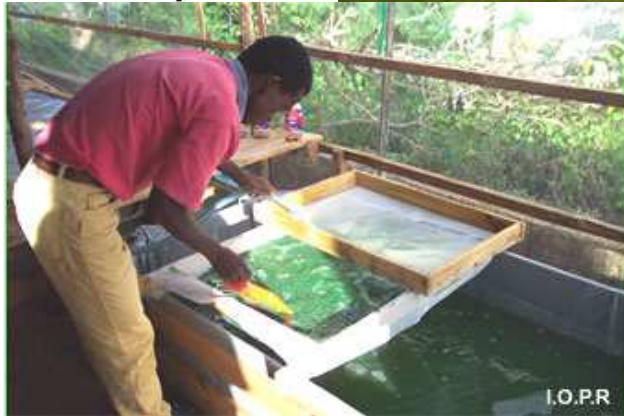
Culture, bac et récolte de spiruline