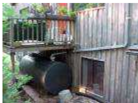
Dans un écovillage, tout est recyclé ou (ré)utilisé, y compris l'eau de pluie.

L'eau du village serait réutilisée et recyclée. Les toits récoltent l'eau de pluie dans les citernes.