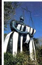
Vues sur le Jardin du Tarot de Niki de Saint-Phalle en Toscane.

Même les toilettes seraient originales et imaginatives (en fait, tout le serait dans l'écovillage).