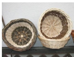
Corbeille basse : 7 €