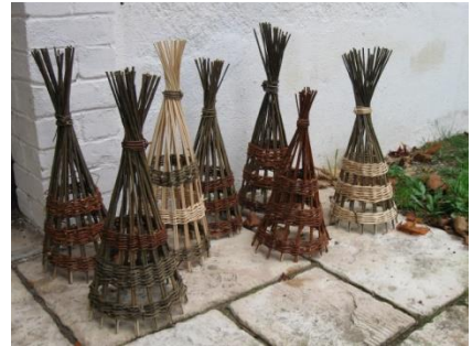
Petite tontine 9 €