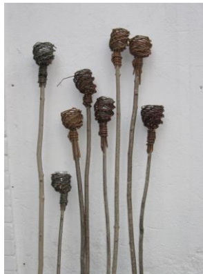
Photophore : 8 €