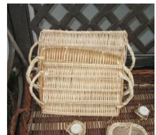
Plateau à fromage : 4 €