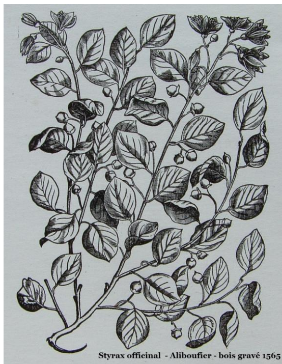
Styrax officinal - Aliboufier - bois gravé 1565

Que de mystères, une histoire, son drôle de nom, son port élégant, tout nous le rend sympathique. Nous pensons qu'il a sa place dans nos jardins naturels pour égayer de son vert frais, lisières, bosquets, sous-bois et espaces à mi-ombre.