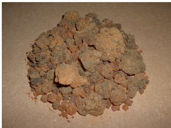
100 g de résine de myrrhe

Améliorez sa vérifiabilité en les associant par des références à l'aide d'appels de notes.