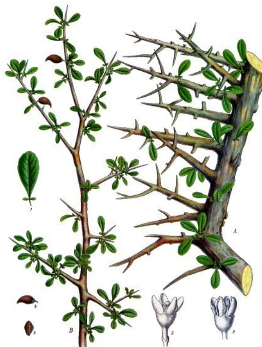
L'arbre à myrrhe, Commiphora myrrha

La myrrhe est une gomme-résine aromatique produite