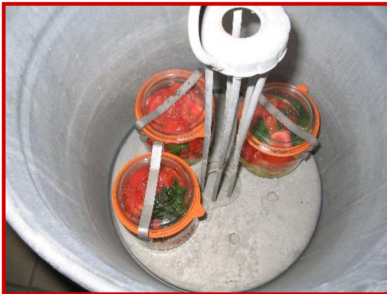
Conservation des tomates par stérilisation Juillet 2006