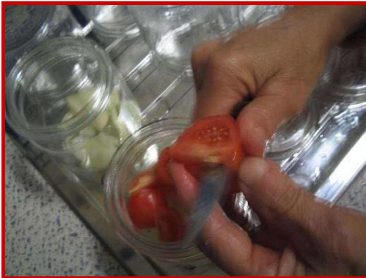
Conservation des tomates par stérilisation Juillet 2006