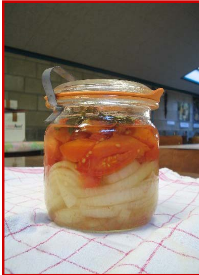
Conservation des tomates par stérilisation Juillet 2006