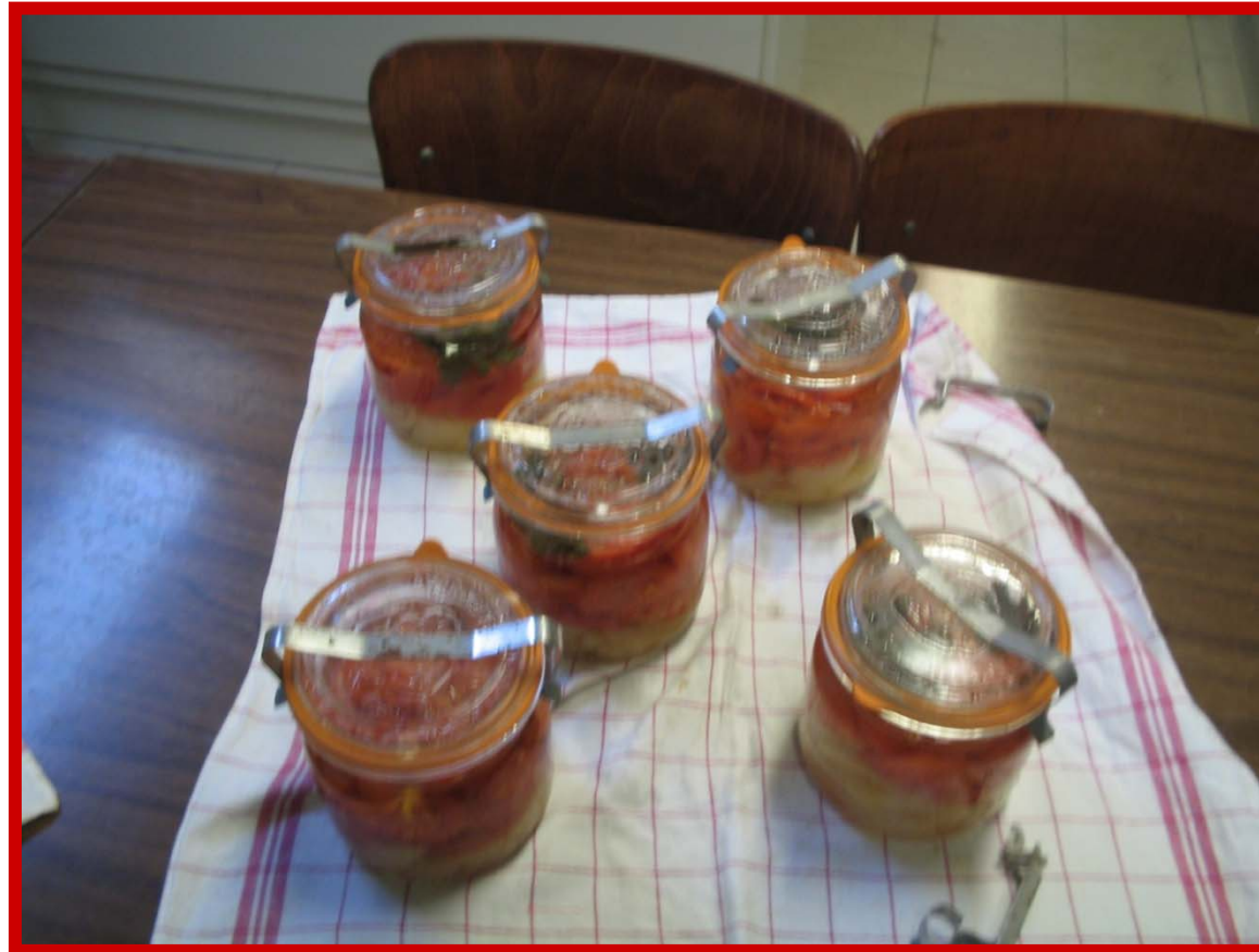
Conservation des tomates par stérilisation Juillet 2006

13) Laisser refroidir les bocaux dans la casserole. Une fois les bocaux refroidis, les sortir avec précaution. Vérifier la fermeture. Si le couvercle n'adhère pas, recommencer toutes les opérations. Ils sont alors prêts à être conservés dans un lieu sec et frais.