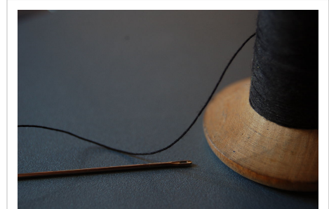
Du fil et une aiguille.

Les outils de couture incluent : aiguille à coudre, aiguille à tricoter, dé à coudre, épingle, épingle de sûreté, ciseaux à couture, machine à coudre, machine à tricoter, mètre ruban, surjeteuse, découseur ou découd-vite, porte épingles, œuf à repriser, machine à couture, bobine colorée et craie pour tissu.