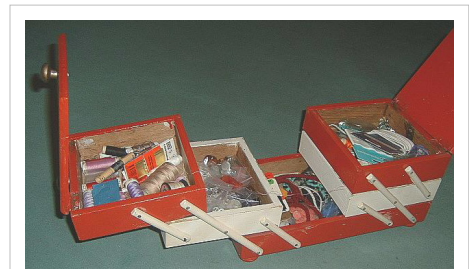
Boîte de couture (~ 1955).

Les accessoires de couture incluent généralement : Bouton, braguette, fermeture à glissière, fil à coudre, galon, patron, velcro et bande en biais. Les éléments du vêtement peuvent être basque, boutonnée (voir bouton), bretelle, capuche, Ceinture, col, épaulette, manche, poche, parmenture, emmanchure et encolure.