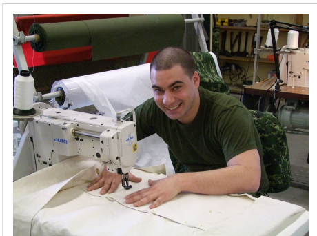
Un militaire qui coud une tente d'armée.

La couture est un métier, mais aussi un loisir. Le professionnel qui pratique la couture est appelé un couturier (ou une couturière). Ses principales tâches sont la confection, la retouche ou l'ajustement de vêtements. Généralement, le couturier est appelé à exercer son métier dans un établissement spécialisé en couture, chez un teinturier, dans une manufacture de vêtements, ou encore dans une boutique de vêtements habillés, lesquelles emploient habituellement leurs propres couturiers. Toutefois, on retrouve la pratique de la couture dans différents corps de métiers, notamment chez les militaires, chez les techniciens des matériaux ou encore dans les industries fabriquant des produits qui nécessitent l'assemblage de textiles comme les tentes, abris, cerfs-volants, courroies, harnets, étuis, métiers du spectacle, etc.