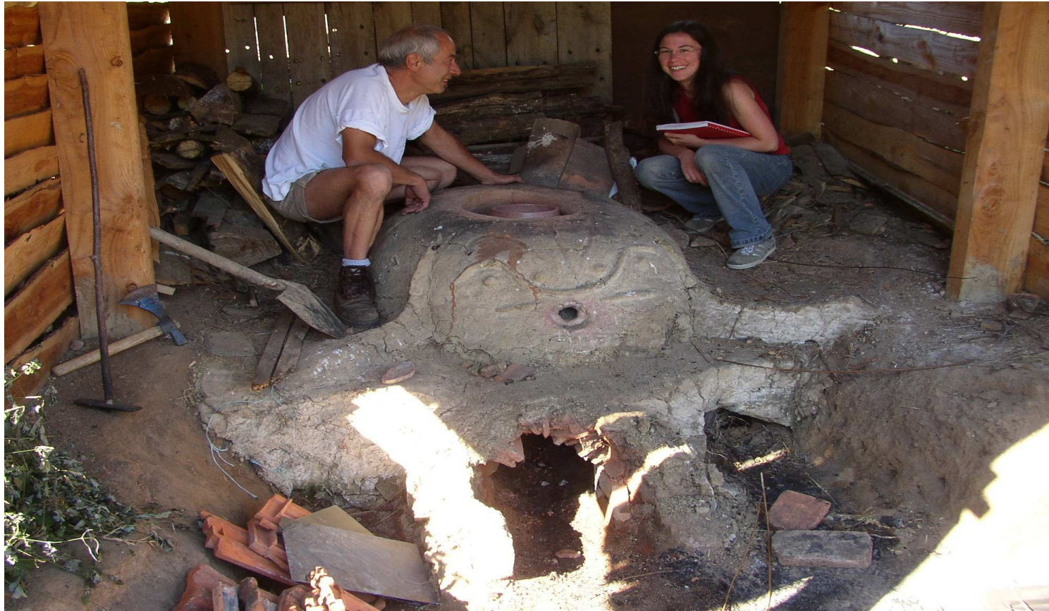
Four à flamme directe