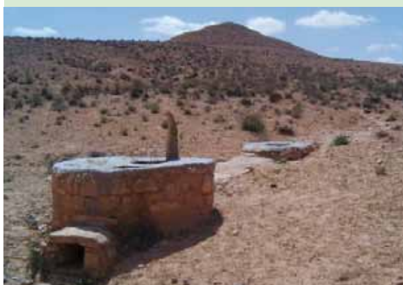
Citerne de collecte d'eau de surface: l'eau est utilisée pour la vie quotidienne du ménage et pour le troupeau.