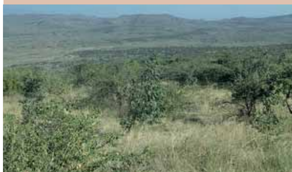
Zone de mise en défens et mesures de conservation supplémentaires en Éthiopie, permettant la repousse de la végétation et la réhabilitation des terres productives après plusieurs années de repos.