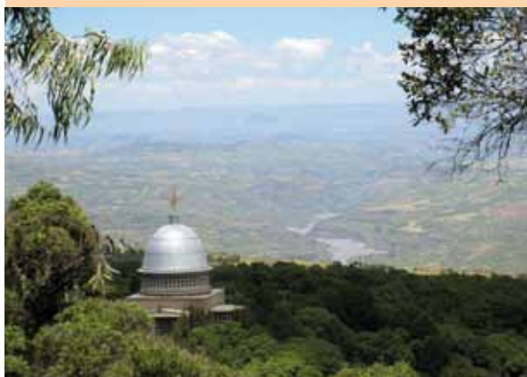
Les forêts autour du monastère de Debre Libanos sont bien protégées alors que les terres environnantes sont soumises à de fortes pressions.