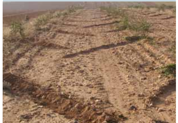
Collecte des eaux de pluie avec labour dans le sens de la pente et sillons en forme de V pour la production d'olives en région méditerranéenne : culture des arbres là où l'eau est rare.

La vallée de Khanasser dans le nord-ouest de la Syrie est une région agricole marginale. Traditionnellement, elle sert au pâturage extensif et à la culture de l'orge. Certains agriculteurs y ont développé des vergers d'oliviers. D'habitude, ils labourent leurs vergers au tracteur pour supprimer les adventices, généralement dans le sens de la pente ; les sillons obtenus favorisent le ruissellement de l'eau et l'érosion. Toutefois, leur association avec des sillons en forme de V et/ou "d'arêtes de poisson" convergeant vers les arbres permet de collecter les eaux de ruissellement et d'améliorer la production. Cette technique économise l'eau d'irrigation en saison sèche, favorise le stockage de l'humidité du sol et stimule la croissance des oliviers. En outre, les fines particules de sol érodées et les éléments nutritifs sont captés par les sillons transversaux.