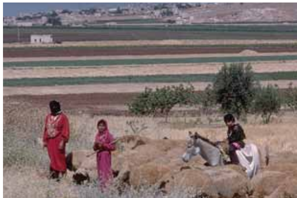
Association de productions animales et végétales: Coexistence de cultivateurs et de pasteurs en Syrie.