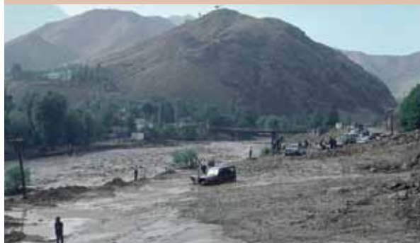
Une tempête importante dans une vallée surpâturée d'Asie centrale, à l'origine d'une crue et d'un glissement de terrain qui ont recouvert la route principale.