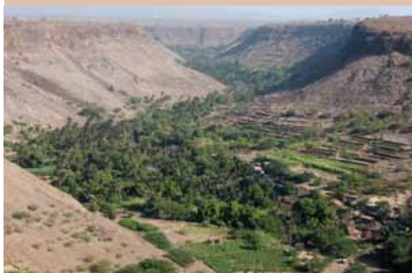
Culture irriguée intensive en zone aride au Cap Vert