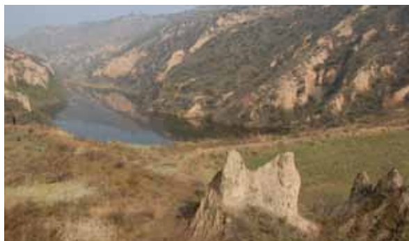
Un barrage de rétention sur le plateau de Loess en Chine piège les sédiments jusqu'à ce qu'il soit entièrement rempli. Il est ensuite utilisé pour la production de céréales.

30% des terres du bassin versant de la rivière Bilate sont dégradées, entraînant de faibles niveaux de production de céréales et d'animaux. La mise en défens de la zone dégradée a ainsi été décidée afin de réhabiliter les terres. La régénération naturelle du couvert végétal s'est effectué par la mise en place de structures de collecte d'eau et de plantation d'arbustes et d'arbres fixateurs d'azote ainsi que d'espèces locales d'herbe. La zone de mise en défens est protégée par une clôture. La réhabilitation nécessite 7 à 10 ans. Après un an, le fauchage et le prélèvement d'herbe pour l'alimentation des animaux d'étable sont en partie permis, offrant un léger bénéfice aux agriculteurs. La participation et l'implication des usagers des terres sont fondamentales pour réussir la mise en œuvre d'une mise en défens car ces terres sont généralement accessibles à tous et ne relèvent pas de la propriété individuelle.