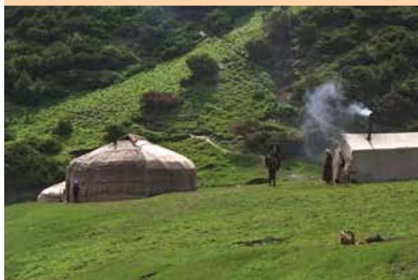
L'élevage et le nomadisme ont une longue tradition et des valeurs qui leurs sont propres.

Les paysages naturels et culturels intacts ainsi que les plantes cultivées endémiques d'un territoire contribuent de manière significative à son identité culturelle. Ils incarnent l'expérience acquise au fil des siècles par les communautés et constituent une expression de leurs caractéristiques et de leurs valeurs historiques et culturelles. Ces paysages naturels et culturels peuvent être préservés tant que les pratiques culturelles associées sont rentables pour les agriculteurs, c'est à dire tant que les rendements répondent à leurs efforts. Lorsque ce n'est plus le cas, ils se tournent vers des solutions plus rentables à risque accru pour l'environnement et provoquant une perte des valeurs culturelles.