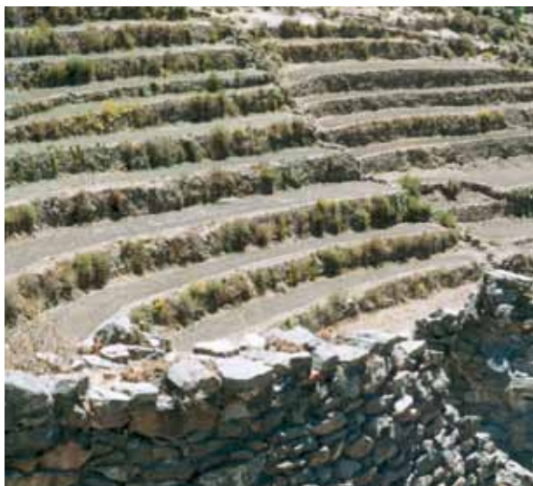
Réhabilitation des terrasses anciennes au Pérou: même si l'investissement est coûteux, elles sont une composante de l'identité culturelle.

Environ un tiers de la population Mongole est constituée de pasteurs nomades. Le nombre minimal d'animaux nécessaires à une famille de pasteurs pour survivre est passé, ces dernières années, de 150 à 250 brebis ou chèvres. La composition des troupeaux a également évolué en faveur des chèvres (cachemire). Il faut jusqu'à 5 ha pour un mouton ou une chèvre. Les zones de pâturage à faible productivité doivent dès lors être utilisées de façon extensive. Les pasteurs distinguent les pâturages de printemps, d'été, d'automne et d'hiver et se déplacent d'une zone à l'autre au rythme des saisons. Ces zones sont souvent séparées par des distances allant jusqu'à 100 km. Mobilité, flexibilité, savoirs traditionnels approfondis (points d'eau, qualité des pâturages, climat local, conditions saisonnières...) sont des pré-requis indispensables au succès de la production animale. Les chevaux et les chameaux jouent un rôle important comme moyen de transport. L'élevage nomade a contribué au développement de cultures aux caractéristiques spécifiques (structure sociale, organisation des ménages, épopées, musique, talents équestres etc.) La liberté de mouvement des populations nomades est de plus en plus limitée par les changements sociaux actuels.