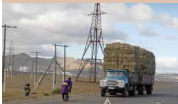
Camion transportant du foin d'une région rurale de la Mongolie vers la capitale : une occasion de revenu, mais aussi un risque de surexploitation des zones rurales.