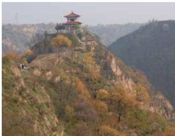
Site culturel sur le plateau de Loess en Chine : les aspects culturels coexistent avec la production de céréales et, sur les pentes, avec la production d'arbres fruitiers.