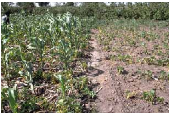
La couverture du sol avec un paillage ou d'autres matériaux joue un rôle crucial dans la réduction de la perte en eau par ruissellement et par évaporation dans les zones tropicales semi-arides.