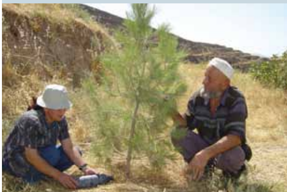
Arrosage des arbres pendant la phase d'établissement le paillage maintient l'eau à disposition des arbres.