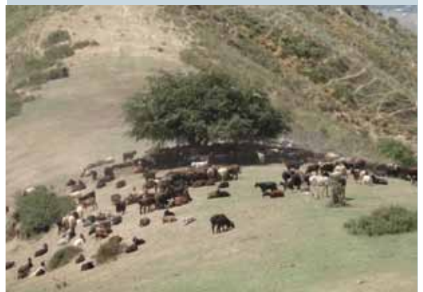
Expérience de pâturage tournant sur les pentes montagneuses au Tadjikistan.

Pendant l'ère soviétique, les pentes escarpées des montagnes du District de Faizabad ont été intensément cultivées, provoquant de graves dégradations des sols. Le pâturage tournant est une option pour une utilisation durable des terres dans cette zone. Un agriculteur près des montagnes Karsang et Tshinoro applique un schéma de rotation de 10 jours à 2 semaines. La journée de pâturage est divisée en deux: 4 heures tôt le matin et 4 heures dans l'après-midi. Les déjections laissées par les animaux améliorent la fertilité du sol, favorisent les espèces appétentes et remplacent les engrais utilisés à l'époque soviétique. Ce système de rotation a également l'avantage d'éviter les chemins de piétinement observés sur les pâtures villageoises surexploitées. Cet agriculteur obtient, pour la vente de ses animaux, des prix plus élevés que ses voisins.