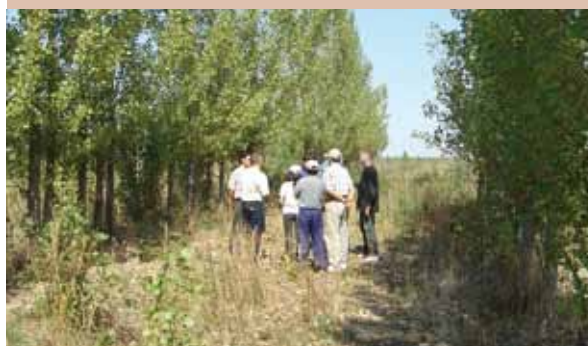
Les peupliers forment un système de drainage naturel dans les zones gorgées d'eau et menacées par la salinisation.