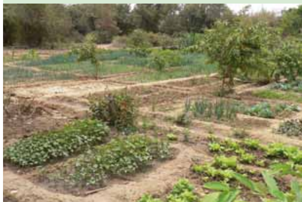
Irrigation à petite échelle au Sahel: produire une nourriture de haute qualité tout en rechargeant les eaux souterraines.