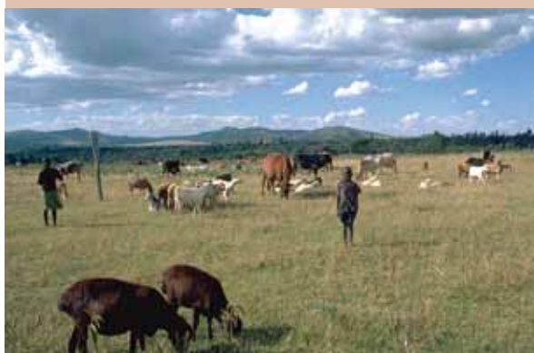
Pâturage : de jeunes bergers gardent un troupeau mixte au Kenya