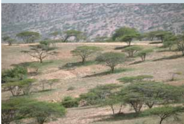
Les terres de pâtures subissant de fortes pressions montrent l'importance du couvert forestier dans l'augmentation de la production fourragère.

Les zones arides réagissent avec une grande sensibilité aux perturbations des cycles de l'eau et de la biomasse. Les fonctions de régulation sont très affectées par une mauvaise gestion du sol et du couvert végétal.