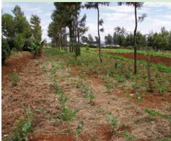
Les systèmes agroforestiers en Afrique de l'Est et du Sud fournissent une multitude de produits et de services sur de petites parcelles de terre: nourriture, fibre, fourrage et bois de feu.