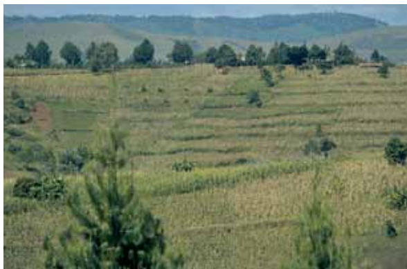
Culture pluviale sur terres en pente, préservées par des bandes végétalisées plantées le long des courbes de niveau. (Tanzania).