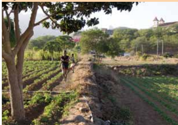
Les «cultures de l'irrigation», qui nécessitent une collaboration étroite entre utilisateurs, se sont développées dans le monde entier.