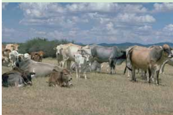
Pâturages: production de viande, de lait et de déjections.

La nourriture, l'eau et l'énergie sont indispensables pour satisfaire les besoins élémentaires de l'homme. La multifonctionnalité liée à un usage durable de la terre rend cette satisfaction possible. En effet, à l'inverse d'un usage monofonctionnel qui vise essentiellement la maximisation du profit, la GDT, multifonctionnelle par nature, cherche à créer des synergies qui génèrent des bénéfices tant économiques qu'écologiques.