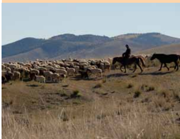
Une longue tradition d'éleveurs et de Khans en Mongolie.