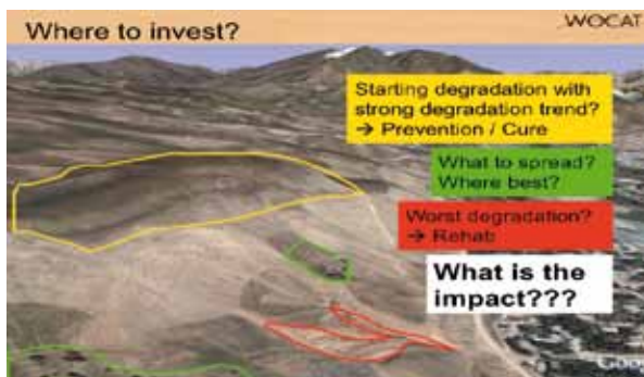
La cartographie de la dégradation et de la conservation (c.à.d. des pratiques de GDT) est la clé de la planification et de la prise de décisions sur les sites d'investissement de lutte contre la désertification.