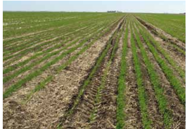
Circulation limitée, perturbation minimale du sol et maintien des résidus de culture sont la clé de la protection des sols et de l'eau dans des zones semi-arides d'Australie.

La production de céréales utilisant le non-labour et des passages de roues permanents se pratique à grande échelle sur une exploitation agricole de 1 900 ha en zone semi-aride dans le Queensland, en Australie. Le principal objectif de cette technique est de supprimer le compactage du sol. Les trois principes de l'agriculture de conservation : travail du sol minimal (voire supprimé), rotation des cultures et couverture du sol sont appliqués autant que faire ce peut. En trois ans, la structure du sol s'améliore, devenant souple, friable et humide entre les lignes de plantations ; cinq ans plus tard, les rendements de sorgho ont augmenté de 3 à 7 tonnes par hectare. Les coûts de travail du semis direct sont 4 fois plus faibles que ceux de la méthode classique. La consommation moyenne annuelle de gazole est même 8 fois moindre, diminuant d'autant les coûts. Cette pratique de GDT a considérablement augmenté les revenus de l'agriculteur.