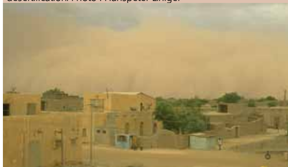
Impacts ex situ d'une exploitation non durable des terres : les tempêtes de poussière bien connues provoquent de nombreux dégâts.