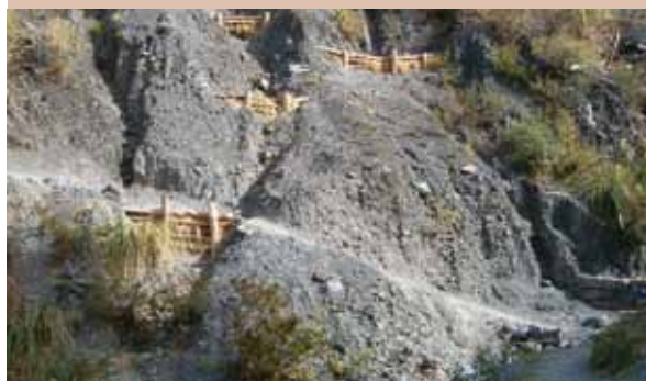
Contrôle de ravines dans un bassin versant en Bolivie grâce à diverses techniques de GDT.