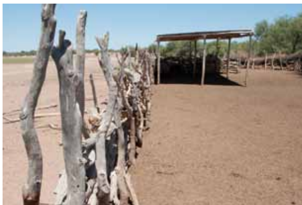
Le parcage nocturne des troupeaux permet d'accumuler les éléments nutritifs qui sont vendus comme engrais à des exploitations de céréaliculture intensive.

Dans le bassin versant de Kiawanja au Kenya, l'arbre Grevillea robusta est utilisé en agroforesterie. Originaire d'Australie et passant par l'Inde, il fut introduit en Afrique orientale comme arbre d'ombrage dans les concessions de thé et de café. Grevillea robusta est souvent présent dans les zones agricoles à petite échelle, surtout utilisé en association avec des cultures annuelles (maïs/haricot) ou pérennes (café). Il est facile à cultiver et à multiplier et ne connaît que peu de ravageurs et de maladies. La concurrence avec les cultures est minime, les branches élaguées repoussent rapidement. Grevillea est un arbre à usages multiples qui répond à différents besoins: il fournit du bois de feu et d'œuvre, sert à constituer des clôtures et a une fonction décorative. Ses feuilles fournissent du fourrage en période de sécheresse ; il permet d'éviter l'effet « splash » des gouttes d'eau (qui contribue à l'érosion et la formation d'une croûte de battance), d'augmenter la matière organique, de fournir du matériau de paillage pour améliorer la couverture du sol sur la ferme, de réduire la vitesse du vent et de favoriser le recyclage des éléments nutritifs du sol par son enracinement profond. Les systèmes agroforestiers contribuent à augmenter la production de bois et de fourrage, à améliorer des rendements des cultures et, ainsi, le revenu agricole.