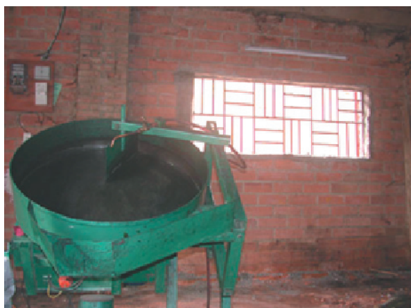
Figure 5: Agglomérateur

Les coûts d'agglomération s'élèvent à US$10-15 par tonne, suivant le taux d'utilisation des équipements. Par exemple, un agglomérateur de grande taille pourrait produire 750 t par an s'il fonctionne à plein temps. Pour être rentable, l'agglomérateur devrait tourner 24 heures sur 24. Le prix de revient des briquettes s'élève à US$ 110 – 140 par t. Avec US$ 360/t, le prix de vente du charbon de bois est plus que le double 11 .