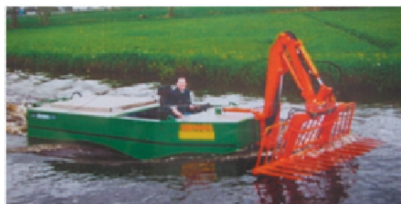
Figure 3: Bateau de faucardeur

Le transport de la biomasse entre les zones de collecte et de carbonisation est assuré par les paysans charre-tiers générant ainsi des revenus substantiels. A titre d'exemple, une unité de production d'une capacité de 1 t/jour de charbon nécessite 27 voyages de charrettes (à raison de 150 kg par voyage), permettant ainsi d'employer au moins 5 charretiers par jour. Les coûts de transport ont été évalués à US$11/t de typha 8 .