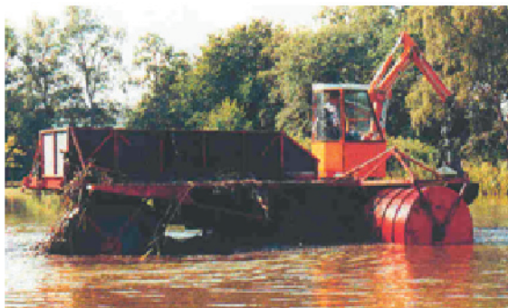
Figure 2: Véhicule amphibie flottant

La récolte mécanique peut aussi se faire avec des bateaux faucardeurs qui forment une plate-forme de travail équipée et qui permettent la récolte d'environ 10 tonnes de matières sèches par heure, voir Figure 3.