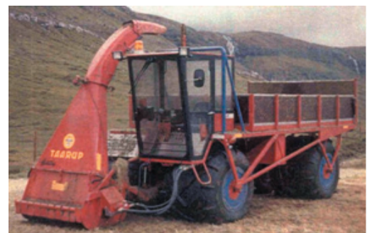
Figure 1: véhicule amphibie

Pour la récolte mécanique il y a des véhicules amphibies ou des bateaux aptes à l'exploitation du typha. Ce type de véhicule est composé d'une plate-forme de travail portée par 4 ou 6 roues à pneus ballons basse pression, sur laquelle différents modules de récolte peuvent être montés, notamment une faucardeuse, une hacheuse, un convoyeur ou une lieuse.