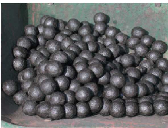
Figure 6: les boulettes

Les coûts d'agglomération s'élèvent à US$10-15 par tonne, suivant le taux d'utilisation des équipements. Par exemple, un agglomérateur de grande taille pourrait produire 750 t par an s'il fonctionne à plein temps. Pour être rentable, l'agglomérateur devrait tourner 24 heures sur 24. Le prix de revient des briquettes s'élève à US$ 110 – 140 par t. Avec US$ 360/t, le prix de vente du charbon de bois est plus que le double 11 .