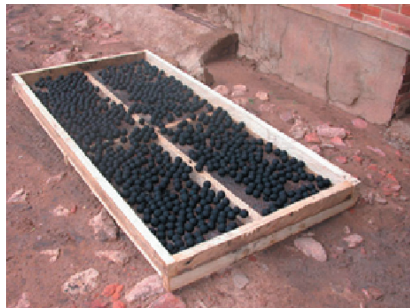
Figure 7: Séchage

Un test de commercialisation 12 devrait être réalisé pour mieux évaluer les aspects de faisabilité. Les marges bénéficiaires potentielles sont assez larges pour que le producteur puisse en principe commercialiser ses briquettes. En fonction de la taille de l'unité de production mise en place et de la mécanisation du processus de collecte, on estime que l'entrepreneur pourrait produire une quantité suffisante de briquettes pour assurer une marge bénéficiaire acceptable !