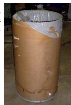
Photo 4 : Fût en carton et isolant en polypropylène expansé. Ce modèle doit être protégé des intempéries

Fût en carton protégé à l'intérieur par un film thermoplastique. Au Brésil, jusqu'à 200 litres.