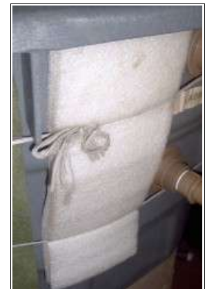
Photo 11 : Polypropylène expansé. Cet isolant souple s'adapte facilement aux canalisations