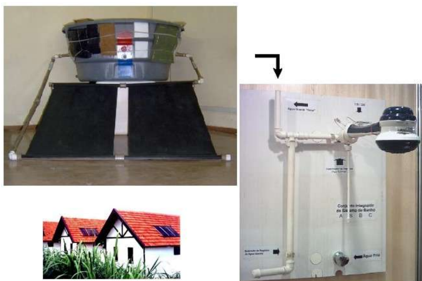
Photo 1 : Modèle du Chauffe-Eau Solaire Bon Marché : Capteurs, réservoir et douche.

Elaboré par la Sociedade do Sol - Société du Soleil