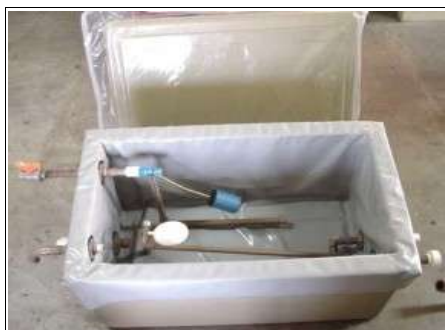
Photo 3 : Réservoir en polystyrène avec film thermoplastique interne

Le système CESBM ayant été pensé pour des couches sociales de faible pouvoir d'achat, les divers types de réservoirs proposés sont bon marché. A suivre, différents options passibles d'être adaptées pour le réservoir thermique :