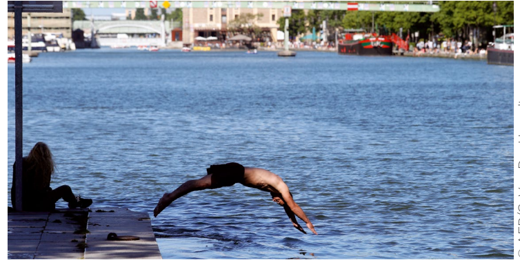
Cet homme a plongé dans le bassin de la Villette à Paris, en mai. Pour l'instant, ce bassin n'est pas ouvert à la baignade.