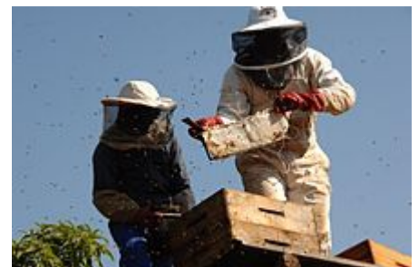
La récolte du miel de façon classique demande beaucoup de travail

Le procédé de la ruche à robinet est beaucoup plus simple. Il requiert peu d'étapes, ne nécessite pas de retirer les cadres de la ruche et évite le besoin de se procurer un extracteur pour le miel qui peut être très dispendieux.