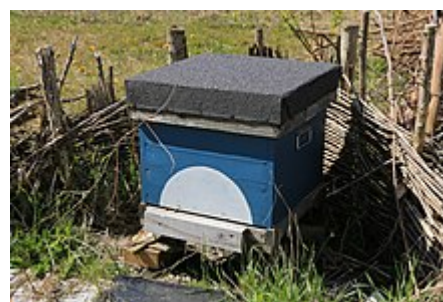
Un exemple de ruche bleue à motif distinctif.