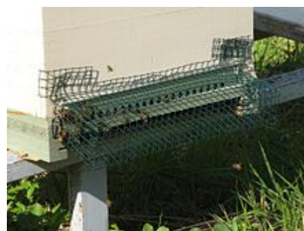
Réducteur d'entrée et grille pour protéger la ruche de frelons.