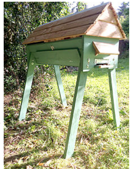
Ruche horizontale à barres.

Un rucher doit aussi être protégé du vandalisme, des animaux sauvages, et du climat. À ce titre, il peut être intéressant d'entourer le rucher d'une barrière (ce qui évitera aussi aux imprudents de se faire attaquer), et de placer les ruches en lisière de forêt, sous les branches d'un arbre. Si le relief est montagneux, les ruchers