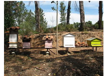
Rucher « classique » au Portugal