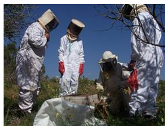
Apiculteurs au Parc National de Souss-Massa (Maroc)