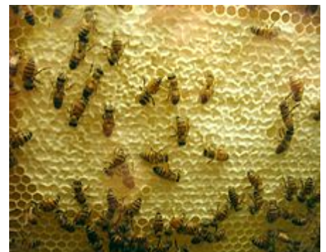
Intérieur d'une ruche artificielle.