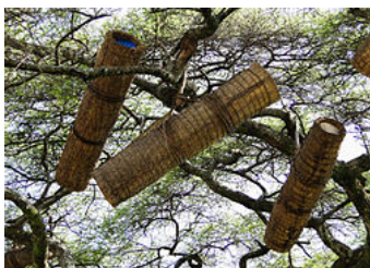
Ruches dans un arbre en pays Konso, Éthiopie