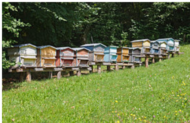
Ruches exploitées près de La Balme-de-Thuy, en Haute-Savoie