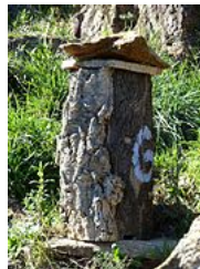
Brusc , ruche traditionnelle en liège près de La Garde-Freinet dans le Var.