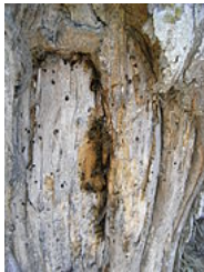
Abeilles dans un tronc d'arbre (marais poitevin)

Il existe également des ruches emmurées, notamment dans la Manche.