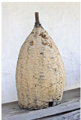
Ruche traditionnelle en osier recouvert de torchis (Roumanie) 4