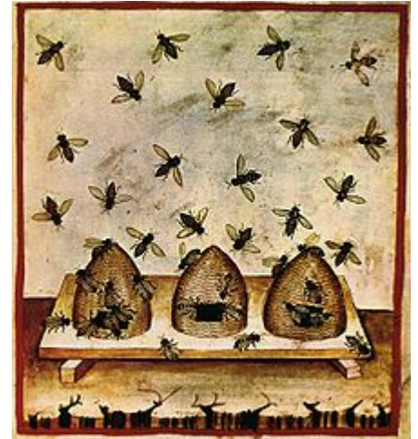
Illustration de ruches tirée d'une version du Tacuinum sanitatis (xiv e siècle).