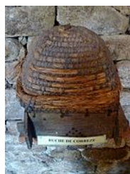
Ruche traditionnelle de Corrèze 5