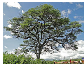
Arbre contenant plusieurs ruches en pays Konso, Éthiopie