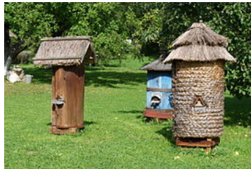
Ruches traditionnelles (Pologne) 3