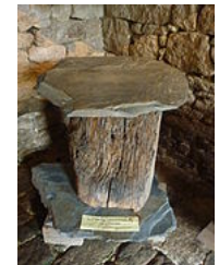
Ruche traditionnelle de Lozère (tronc de châtaignier évidé recouvert d'une pierre) 5