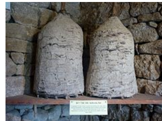
Ruches de Sologne constituées d'osier tressé et de bouses de vache 5