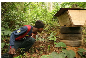
Ruche à Tayap (Cameroun)