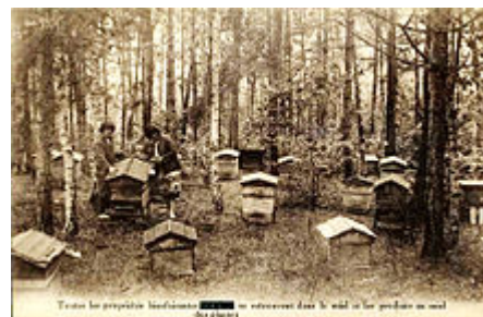
Ruchers installés en lisière d'une forêt.

On peut utiliser une simple peinture acrylique mais il existe des peintures "spéciale ruches" contenant de l'aluminium destiné à limiter les montées en température.