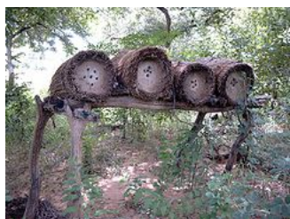
Ruches dans la région de Fada N'Gourma (Burkina Faso)

La modernisation des ruches dans le cadre de projets de développement rural permet de rentabiliser et rationaliser l'exploitation. Elle joue un rôle appréciable dans le développement économique local.