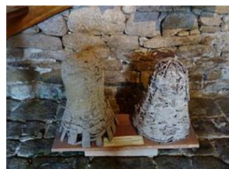
Ruche traditionnelle des Landes 5