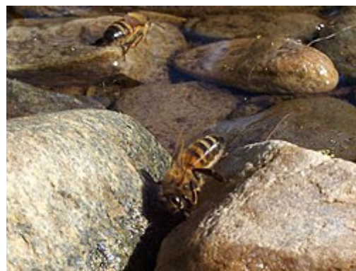
Abeilles en train de boire