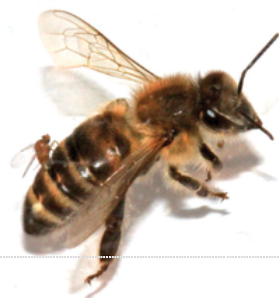
Femelle d' Apocephalus borealis en train de pondre ses œufs dans l'abdomen d'une abeille domestique . L'opération ne prend que 2 à 4 secondes.

Le virus IAPV : une étude parue dans la revue Science en 2007 fait état de l'analyse des organismes commensaux des abeilles s'étalant sur une période de trois ans 18 . Ce rapport a déterminé que le virus israélien de la paralysie aiguë ( Israeli acute paralysis virus of bees , ou IAPV), initialement décrit par un chercheur israélien, est fortement corrélé avec le syndrome d'effondrement des colonies. Selon l'un des coauteurs de l'étude, Ian Lipkin : « nos résultats indiquent que l'IAPV est un marqueur significatif du CCD. L'étape suivante est de déterminer si l'IAPV, seul ou de concert avec d'autres facteurs peut induire le syndrome chez des abeilles saines. » Pour le moment on ne sait pas si ce virus est un symptôme ou une cause de l'effondrement. Les effets de l'IAPV sont multiples :