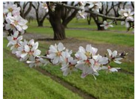
La pollinisation des champs d'amandiers de Californie nécessite l'importation de colonies d'abeilles. Ces déplacements massifs d'abeilles ont aussi pu contribuer à diffuser des pathogènes entre les élevages d'une part et à les diffuser dans le reste du pays, y compris chez les espèces de butineurs sauvages.

Le Conseil fédéral a suspendu les néonicotinoïdes clothianidine, imidaclopride et thiaméthoxame présents dans des pesticides commercialisés par le groupe suisse Syngenta et l'Allemand Bayer pour deux ans en attendant des études complémentaires. Deux motions ont été adoptées, visant à mettre en place un plan d'action national pour étudier scientifiquement les causes de la mortalité des abeilles, et une seconde visant à réduire les risques et l'usage des produits phytosanitaires d'ici 2023. L' Union suisse des paysans , Apisuisse et le Centre de recherches apicoles d' Agroscope souhaitent un plan national de mesures afin de mieux cerner les causes de la mortalité des abeilles. Ils prônent une approche globale plutôt que des interdictions « précipitées » de produits phytosanitaires 52 ;