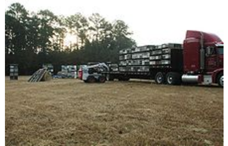
Apiculteurs américains chargeant des "ruchers itinérants" sur un semi-remorque pour les transporter de l'état de Caroline du Sud à celui du Maine pour la pollinisation d'espèces d'intérêt commercial (myrtilles en l'occurrence)

— Thomas Minder (politicien suisse sans étiquette mais proche des écologistes 51 , entrepreneur dans le dentifrice et les produits d'hygiène buccale)