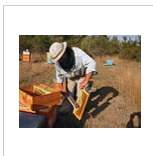
Récolte des cadres du magasin à miel