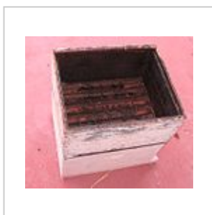
Hausse avant mise en place des cadres