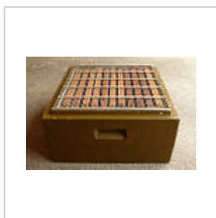
Corps de ruche et grille à reine

Le rajout d'une hausse à couvain et/ou de hausses à miel permet aussi d'éviter l'essaimage 1 .