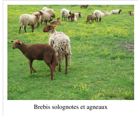
Brebis solognotes et agneaux

Sa laine à la couleur caractéristique est valorisée localement, poursuivant la longue tradition lainière de la région.