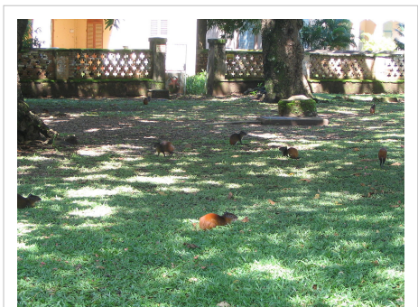
Agoutis sur l'île Royale, en Guyane.