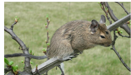
Un octodon au pelage « agouti ». On voit clairement plusieurs nuances dans la longueur du poil.