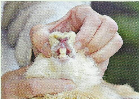
Vérifiez régulièrement que le lapin use bien ses dents. Si elles se chevauchent, faites appel à un vétérinaire.

Un aliment trop humide, fermenté ou porteur de moisissures voire une nourriture inadaptée (pauvreté en