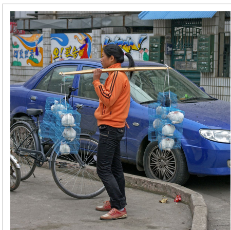
Vendeuse ambulante de jeunes lapins en cage en Chine (2008).