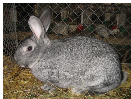
Le lapin domestique, de race géante ou standard, est élevé dans le monde entier pour sa peau et sa chair. Il existe de nombreuses races de lapins.