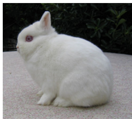
Les races de lapins nains fournissent surtout des animaux de compagnie.