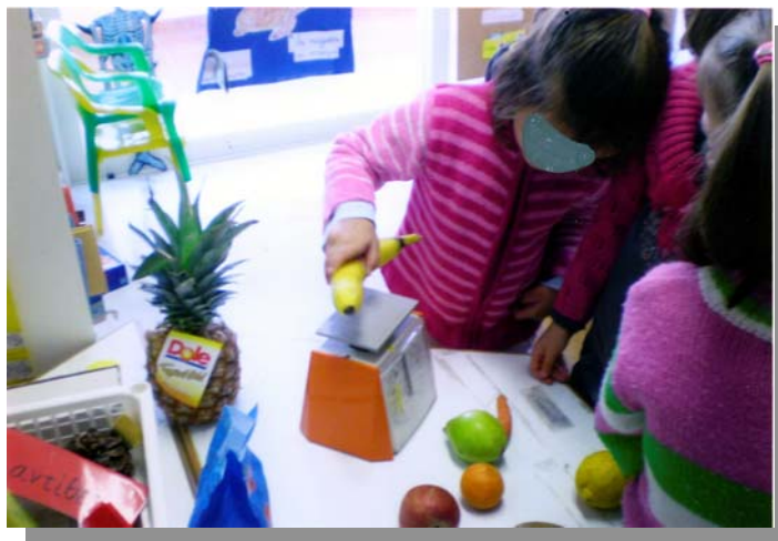
Ecole Au petit bonheur Glyfada Grèce juin 2008

Nous allons donc vérifier si la balance peut vraiment nous aider.