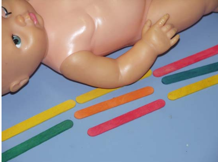
Ecole Au petit bonheur Glyfada Grèce juin 2008

Les enfants, cette fois –ci reproduisent ce qu'ils ont vu la séquence précédente, nos étalons varient.