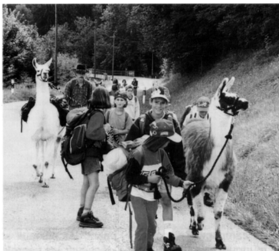
Course d'école avec des lamas