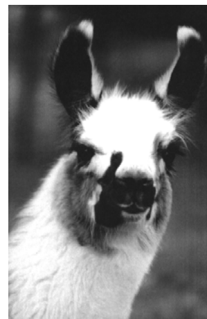
Un lama aux aguets