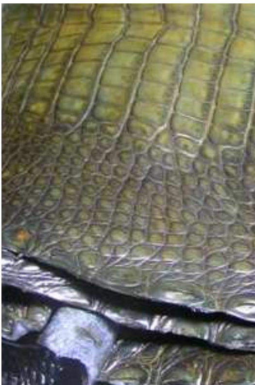
Cet alligator mordoré de France Croco a d'abord subi une teinture bleue puis une patine façon bottier dans un coloris gold et enfin un glaçage à la main

dans cette activité. "Il y a encore cinq ans, nous ne disposions que de deux finitions dans une dizaine de coloris, déclare son directeur commercial Michael Perez. Aujourd'hui nous en proposons cinq ou six dans six cents couleurs" . En effet, à partir des deux finitions mate et brillante traditionnelles, plusieurs variantes se sont développées pour diversifier l'aspect du crocodile : nappa tout en souplesse, moelleux, toucher gras, dégradé ou patiné, le crocodile et ses assimilés prennent désormais de multiples apparences, des plus sensuelles aux plus glamour.