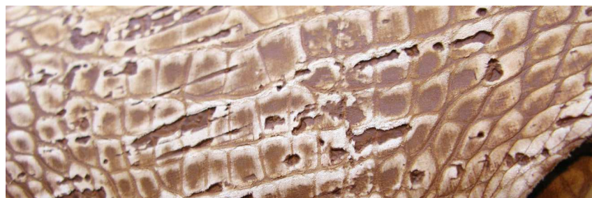
Superbe Croco façon liège mât chez HCP (TCIM-Gordon Choisy)