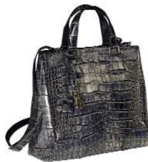
Sac Orlov de Céline en croco métallisé et patiné