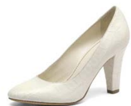
Le croco est aussi utilisé pour la chaussure de luxe, comme ici sur cette snicker masculine ou cet escarpin féminin de Testoni