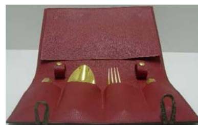
Virtuose reconnu des crocodiliens, Serge Amoruso ne travaille que sur commande pour des pièces uniques. De Gauche à droite : Portefeuille en porosus mat, Etui à couverts en niloticus mat doublé de chèvre marocain rouge