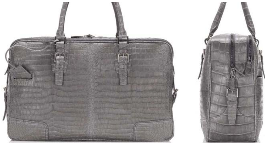
Depuis 2004, Camille Fournet propose aussi sous son nom de très beaux sacs en alligator, comme ce 48 heures dessiné par Florian Denicourt

C'est qu'il faut une bien large variété de matières pour répondre à toutes les applications du croco. Pour le bracelet de montre, qui constitue le plus gros débouché de l'alligator en nombre de peaux, les petits formats de jeunes animaux d'élevage, n'excédant pas 20 à 30 cm de largeur de ventre, sont parfaits. La petite maroquinerie peut se satisfaire des mêmes gabarits. Mais pour les sacs, les bagages, les vêtements et même les ceintures et chaussures, des peaux plus grandes sont nécessaires, jusqu'à 90 cm de largeur de ventre. Ne parlons pas de l'ameublement, où pourtant il se développe pour l'aménagement de cabines de yachts ou de voitures de luxe, par exemple, et où les surfaces à revêtir sont considérables.