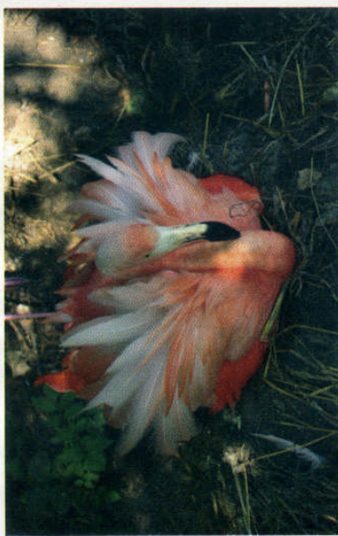
Tous les flamants ne peuvent être détenus qu'au sein d'élevages dûment autorisés.

La détention de ces espèces sans être titulaire d'une autorisation constitue une infraction.