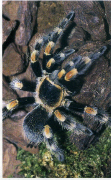
Les animaux dangereux tels que la mygale ne peuvent pas être détenus sans autorisation.

Un simple particulier ne pourra acquérir ou détenir une telle espèce. En revanche, il peut détenir des animaux d'entretien plus facile.