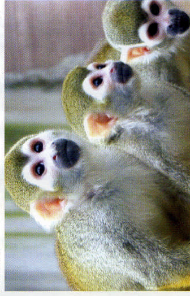
Comme tous les singes, le soimiri ne peut être détenu qu'au sein d'un élevage dûment autorisé.

Un établissement d'élevage peut être professionnel ou amateur.