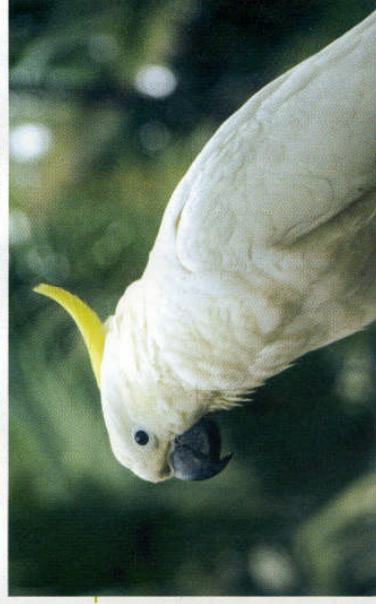
Le Grand Cacatoès à huppe jaune ne peut être détenu qu'au sein d'un élevage dûment autorisé.

Toutefois, pour certaines espèces protégées, une autorisation