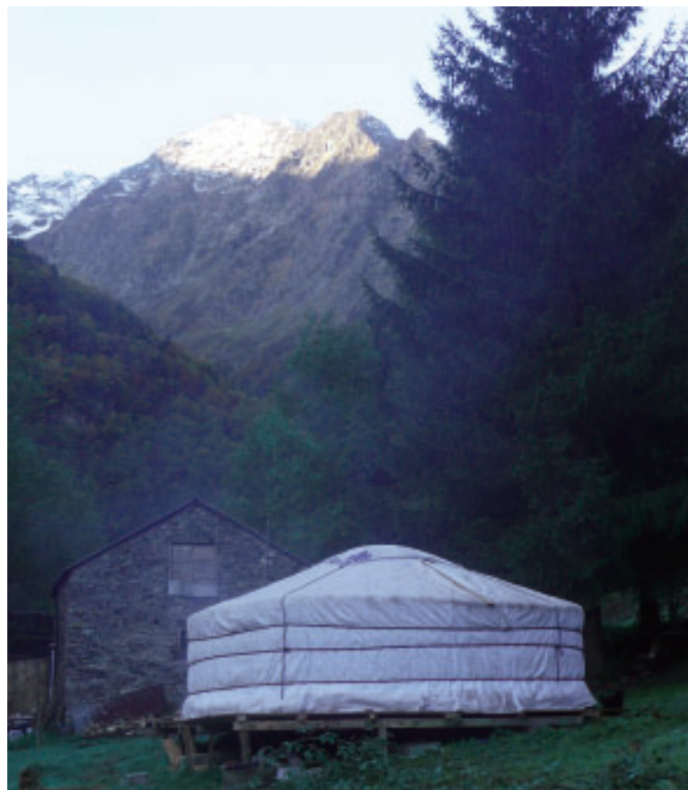
La yourte au pied des cimes..

Visite de l'estive avec dégustation de lait d'ânesse tous les après-midi en semaine de 14 h à 18 h en juillet et août Nuitée en yourte pour 2 à 4 personnes : 50 euros, réservation : 05 61 04 65 91