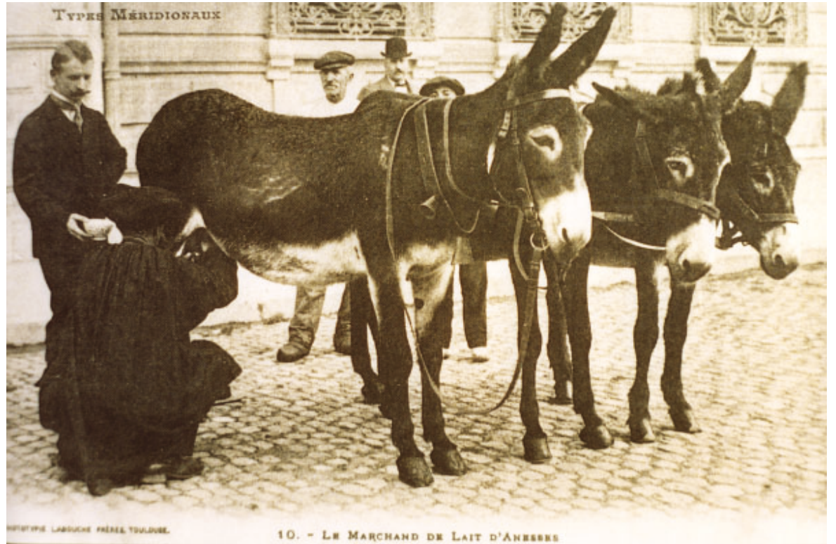
Vente de lait d'ânesse dans les rues de Toulouse en 1910

Sa composition proche de celle du lait humain explique le fait qu'il apporte des éléments es-