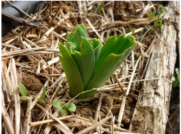
Ce poireau repousse après une première récolte et cela malgré une coupe sévère faite en terre au plus près du bulbe.

Récolte : j'utilise le gros couteau que j'enfonce en terre jusqu'à atteindre le bulbe qui forme la base du poireau. Là, j'ai le choix entre couper au-dessus du bulbe – celui-ci reste en terre et un second poireau en repousse ! – ou en dessous : on peut alors manger le bulbe, partie la plus délicieuse du poireau, mais ce sera la fin de vie de la plante. À la première récolte entre octobre et décembre, je laisse de préférence le bulbe pour obtenir un second poireau. Puis je récolte l'ensemble du poireau qui a repoussé avant avril.