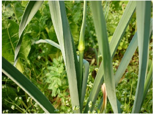
Apparition de la tige florale en avril... ce poireau ne sera plus agréable à manger.

Remarquez cependant que vous n'êtes pas obligé d'enfoncer vos poireaux profondément ! Ce n'est d'ailleurs pas ce que demande la plante... On cherche simplement à priver de lumière le fût du poireau afin qu'il reste blanc et tendre. Mais ce n'est pas capital de le faire, il se mangera bien quand même ! Ainsi, vous pourriez même semer vos poireaux en surface et les éclaircir pour n'en laisser que le nombre suffisant.