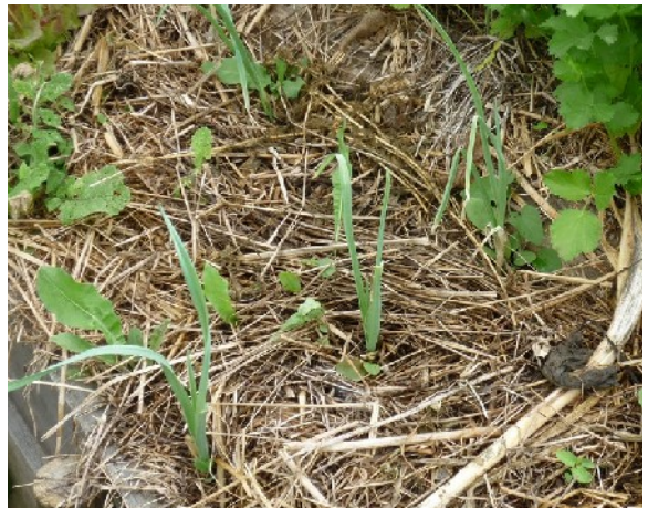
Jeunes poireaux repiqués en mini-ligne dans la bande extérieure.

Plantation : la pelle à main permet de fendre le sol profondément, jusqu'à 15 cm au maximum, puis d'entrouvrir la terre pour y glisser le plant de poireau, derrière l'outil. Il n'y a plus qu'à enlever soigneusement la pelle. Ne tassez pas la terre qui reste légèrement entrouverte . Lors de votre première année, comme le sol aura été labouré du fait du pelletage de la butte, vous pouvez utiliser le plantoir pour faire un trou et y mettre le poireau, c'est la méthode traditionnelle. En deuxième année, ce ne sera sans doute plus possible puisque le sol se sera restructuré. Il donnera alors l'impression d'être trop compacté sous les 2 à 5 cm de terre en surface, mais cet état de sol est normal. S'il devient plus aéré sous les premiers centimètres de terre, c'est encore mieux ! Mais ne forcez pas cet état de chose, vous créez des problèmes. Ce sont les racines et les habitants du sol qui doivent améliorer leur milieu de vie. Votre