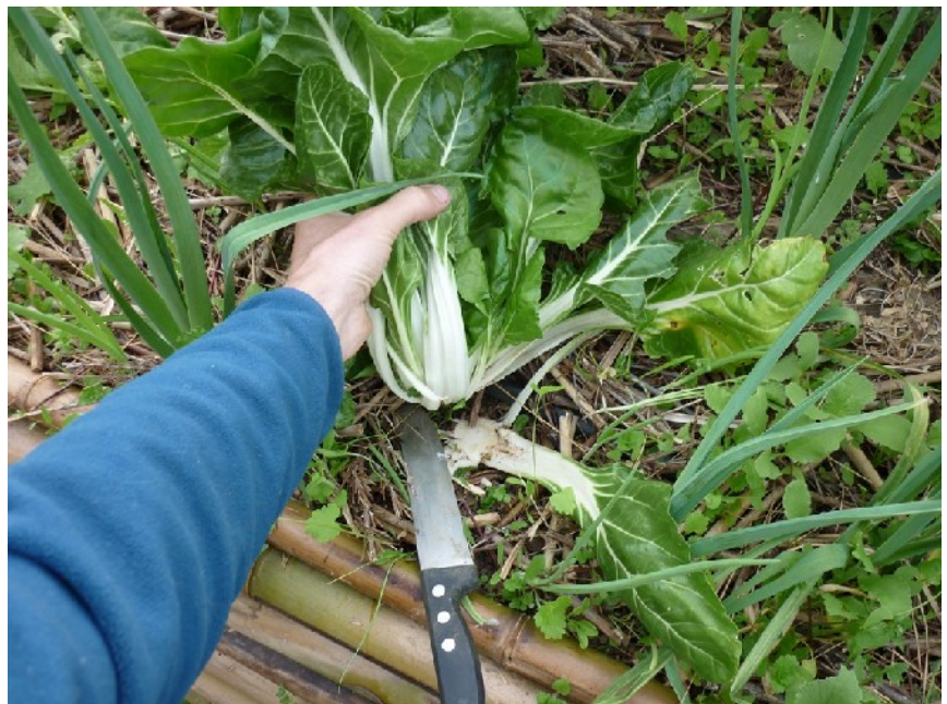
Malgré une coupe franche à la base lors de sa récolte, ce pied de blette repoussera généreusement.

Récolte : on coupe à 1 ou 2 cm du sol l'ensemble des feuilles en une seule fois avec le gros couteau, ou bien on cueille les feuilles une à une en les cassant à la base et en laissant les jeunes pousses du milieu.