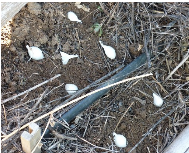
Ces six bulbilles sont juste posées sur le sol et seront aussitôt recouvertes d'une couverture de 2 à 5 cm.

Depuis peu, j'ai découvert une façon bien plus simple de procéder : je pose les bulbes tout simplement sur le sol, sous la couverture ! Étonnamment, la plante finit par reprendre sa forme habituelle et produit normalement. J'ai observé le même phénomène avec les plants de mâche ! La condition est de le faire au moins 15 jours avant l'arrivée des froids , soit vers fin septembre/début octobre, pour donner le temps aux racines de se développer correctement.