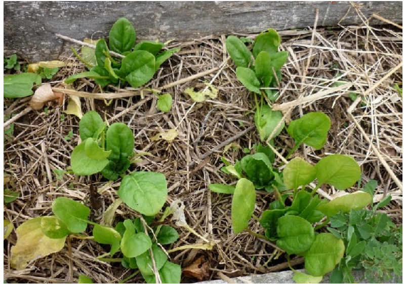
Six plants d'épinard installés dans la bande extérieure de culture.

Plantation ou semis : enterrez la motte entièrement. J'avoue ne pas avoir essayé de la poser juste sur le sol comme pour la mâche. Le semis en surface est assez facile. On peut semer une bande de 10 cm comme pour la mâche. Chez moi, le grand prédateur du semis d'épinard est l'escargot ! Je passe régulièrement voir, et je laisse tranquille les escargots tant qu'il n'y a pas de dégâts importants.