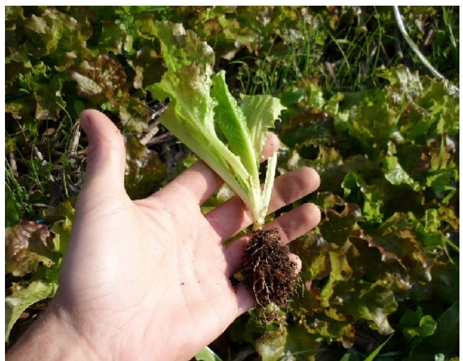
Cette salade retirée de la pépinière est prête à être transplantée dans la butte : on a coupé ses grandes feuilles et raccourci sa longue racine.

Plantation : la plantation se fait avec la cuillère à soupe ou la pelle à main. Dégagez la couverture, faites un trou juste un peu plus large que nécessaire, plantez à une profondeur permettant à la base des feuilles de ne pas se trouver sous la terre. Remettez la terre et