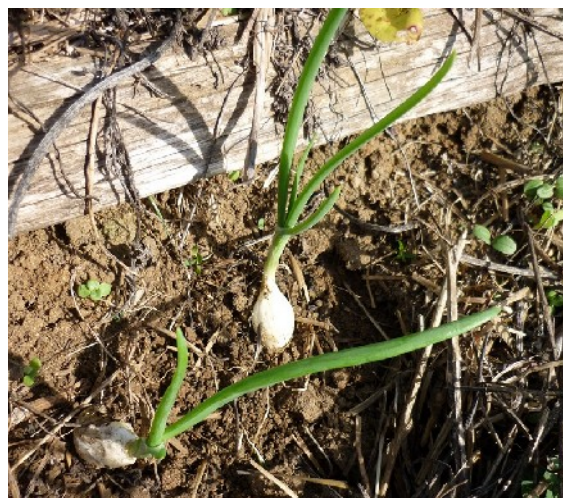
La plante pousse sans problème. La couverture a été dégagée pour montrer que les bulbilles se sont bien enracinées d'elles-mêmes.