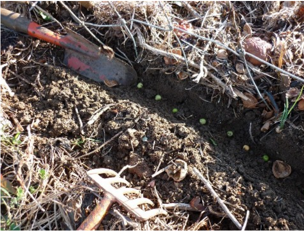
Semis de pois à rame au pied de la structure grillagée.