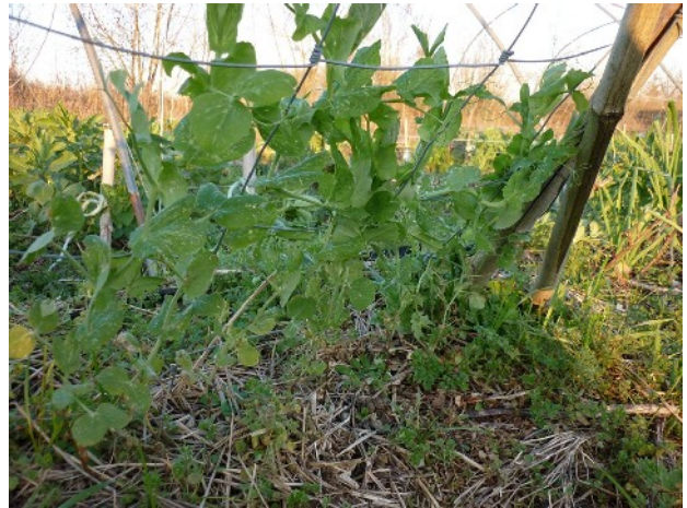
On peut avoir besoin par endroits de guider la plante sur le grillage qu'elle trouve cependant facilement.

Récolte : tirez sur la cosse en prenant garde de ne pas arracher toute la plante ! La récolte se fait lorsque la cosse est bien pleine et les grains encore sucrés. Ils sont alors excellents crus ou cuits . Passé ce stade, ils deviennent nettement moins sucrés, mais vous pouvez encore les faire cuire. Le grain sec peut servir de semence pour l'an prochain.