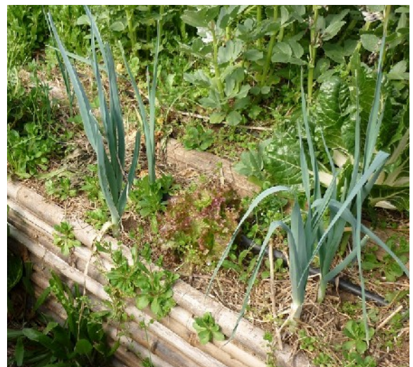
Poireaux et salades vont de pair.