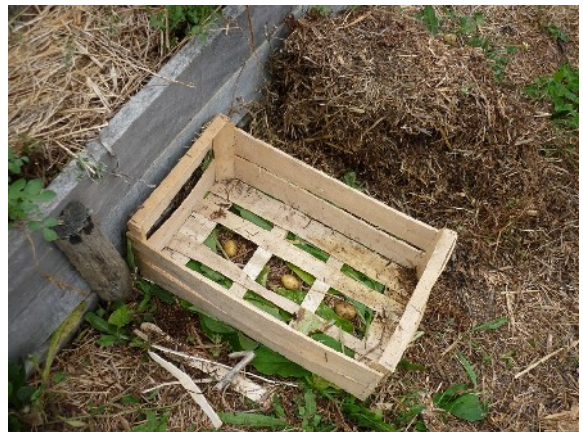
Les feuilles de consoude sous la cagette participeront à la fertilisation.

N'enlevez pas les matériaux déjà au sol, sauf pour en réduire l'épaisseur à 5 cm. Déposez deux ou trois pommes de terre semences en ligne, en contact ou non avec la terre. Éventuellement, avant cela, ajoutez des coupes fraîches de feuilles de consoude, riche en potasse et en azote, de luzerne, de vesce ou de trèfle, sur une épaisseur totale de 5 à 10 cm au maximum, et complétez avec 5 à 10 cm de déchets de cuisine . Ensuite, posez la cagette par-dessus (vous aurez préalablement dégagé le fond en retirant un peu de bois en deux ou trois emplacements