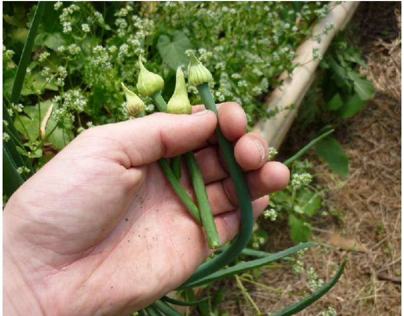
Coupez les têtes florales le plus tôt possible.

J'ai rarement vu de floraison sur les échalotes. Celles des oignons et de l'ail interviennent autour d'avril. Sur une variété d'oignons blancs, une année, j'ai constaté que la floraison avait « vidé » les bulbes, la plante concentrant probablement tous ses efforts dans la production de graines. Du coup, il n'y a pas eu de récolte d'oignons. Maintenant pour cette variété, je coupe systématiquement la tête de la fleur lorsqu'elle apparaît.