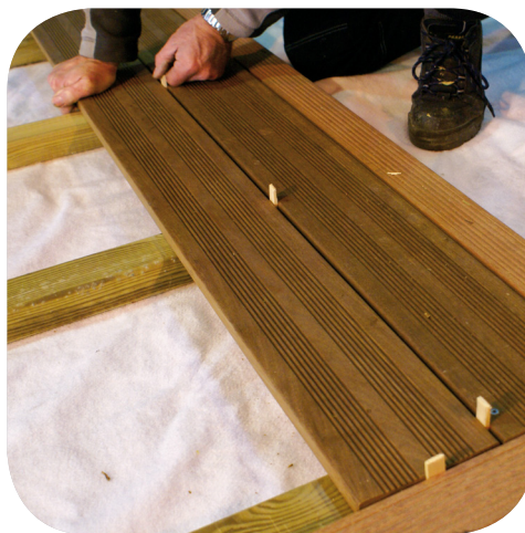
Répétition de l'opération

► L'idéal reste de poser les lames à une saison d'humidité moyenne pour la région