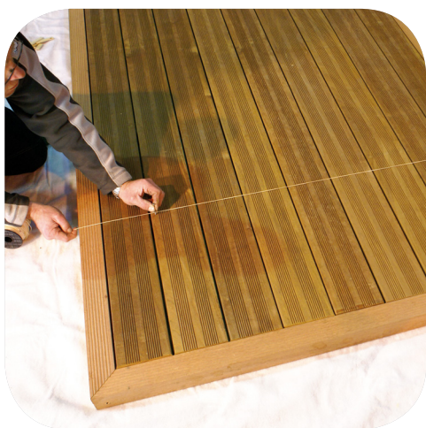
Alignement au cordeau