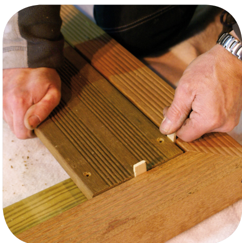
Placement des cales