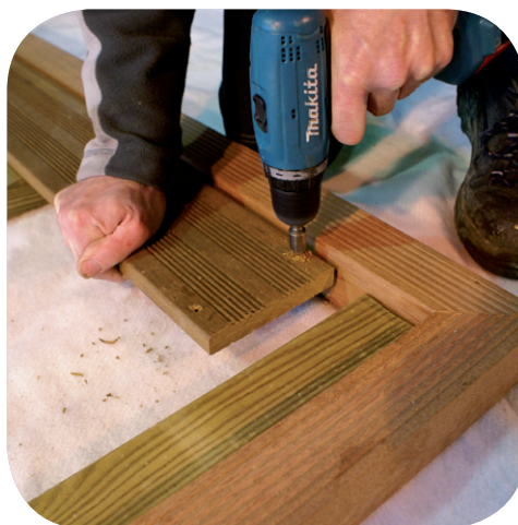
Préperçage pour bois exo

Une fois toutes les lames en place, préparez les emplacements des vis en les alignant avec un cordeau puis vissez. Pour plus de facilité, vous pouvez commencer par fixer les extrémités.