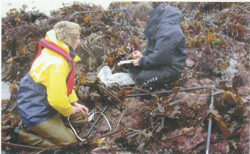
Le programme Idealg s'est donné pour mission de mieux appréhender la biologie des macroalgues et l'environnement qui leur est propice. Un travail qui doit accompagner et faciliter l'essor de leur mise en élevage.