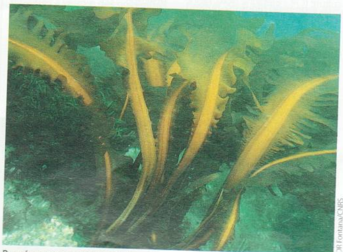
Représentant quelques dizaines de tonnes, principalement Undaria pinnatifida , la production de macroalgues en France est surpassée par les asiatiques.

(1) Dans un dossier paru début décembre, le magazine Produits de la mer (n°130) détaille toutes les spécificités et les perspectives du marché de l'algue alimentaire en France.