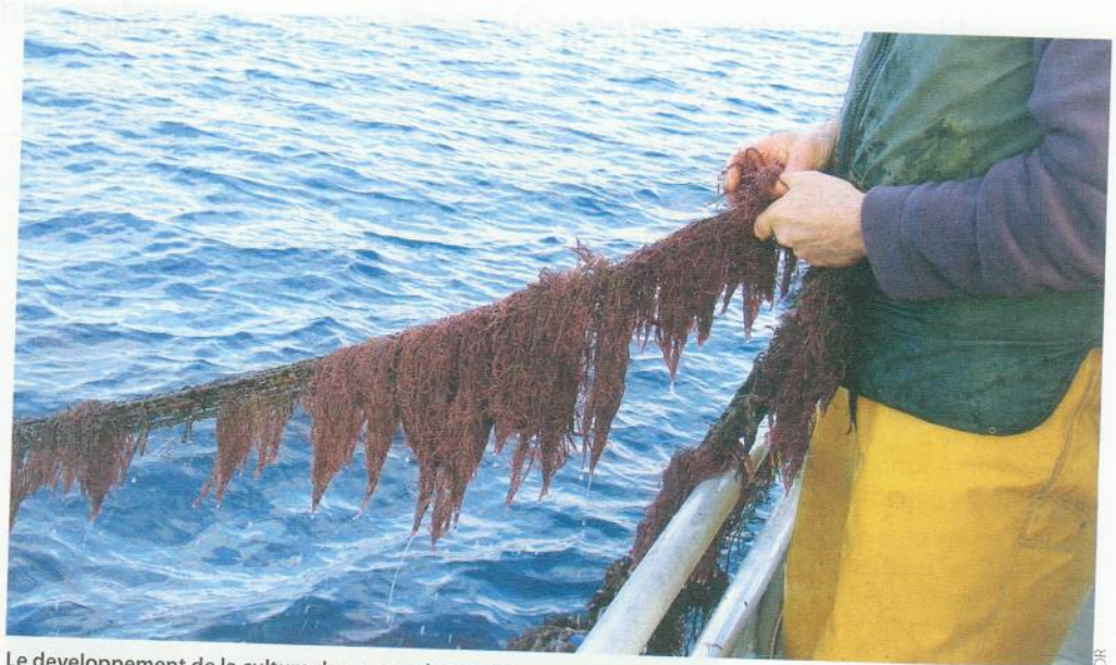
Le développement de la culture des macroalgues offre une voie alternative aux conchyliculteurs pour compléter leurs sources de revenus.