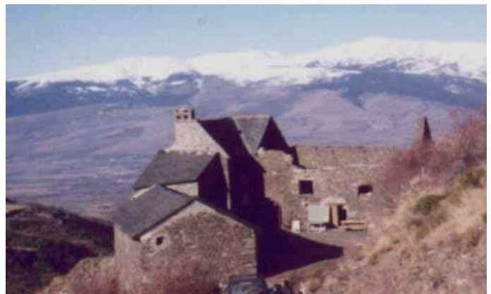
Mas agricole en rénovation

Il est donc possible de reconvertir un bâtiment agricole désaffecté en structure d'accueil (gîte, ferme auberge, ...) sous réserve que le bâtiment soit identifié par le POS/PLU.