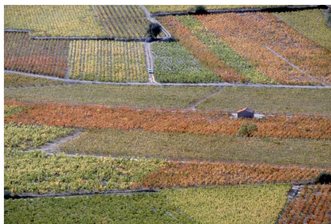
Vignoble à l'automne