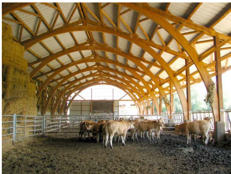
Bâtiment d'élevage à Palau de Cerdagne

Un Règlement Sanitaire Départemental, validé par arrêté préfectoral, encadre les conditions de nombreuses activités et aménagements. S'agissant des activités agricoles, il encadre l'implantation des bâtiments d'élevage, de toute taille et impose le dépôt d'un dossier de déclaration auprès de la DDASS. L'application de cette réglementation est du ressort du Maire.