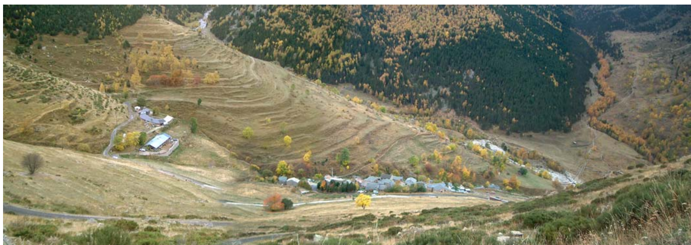
village de Mantet

« Les terres nécessaires au maintien et au développement des activités agricoles, pastorales et forestières sont préservées. La nécessité de préserver ces terres s'apprécie au regard de leur rôle et de leur place dans les systèmes d'exploitation locaux. (...) Les constructions nécessaires à ces activités [agricoles, pastorales et forestières] (...) peuvent être autorisées [sur les terrains correspondants]. Peuvent être également autorisées, par arrêté préfectoral, après avis de la CDNPS, la restauration ou la reconstruction d'anciens chalets d'alpage ou de bâtiments d'estive, ainsi que les extensions limitées de chalets d'alpage ou de bâtiments d'estive existants lorsque la destination est liée à une activité professionnelle saisonnière » 52 .