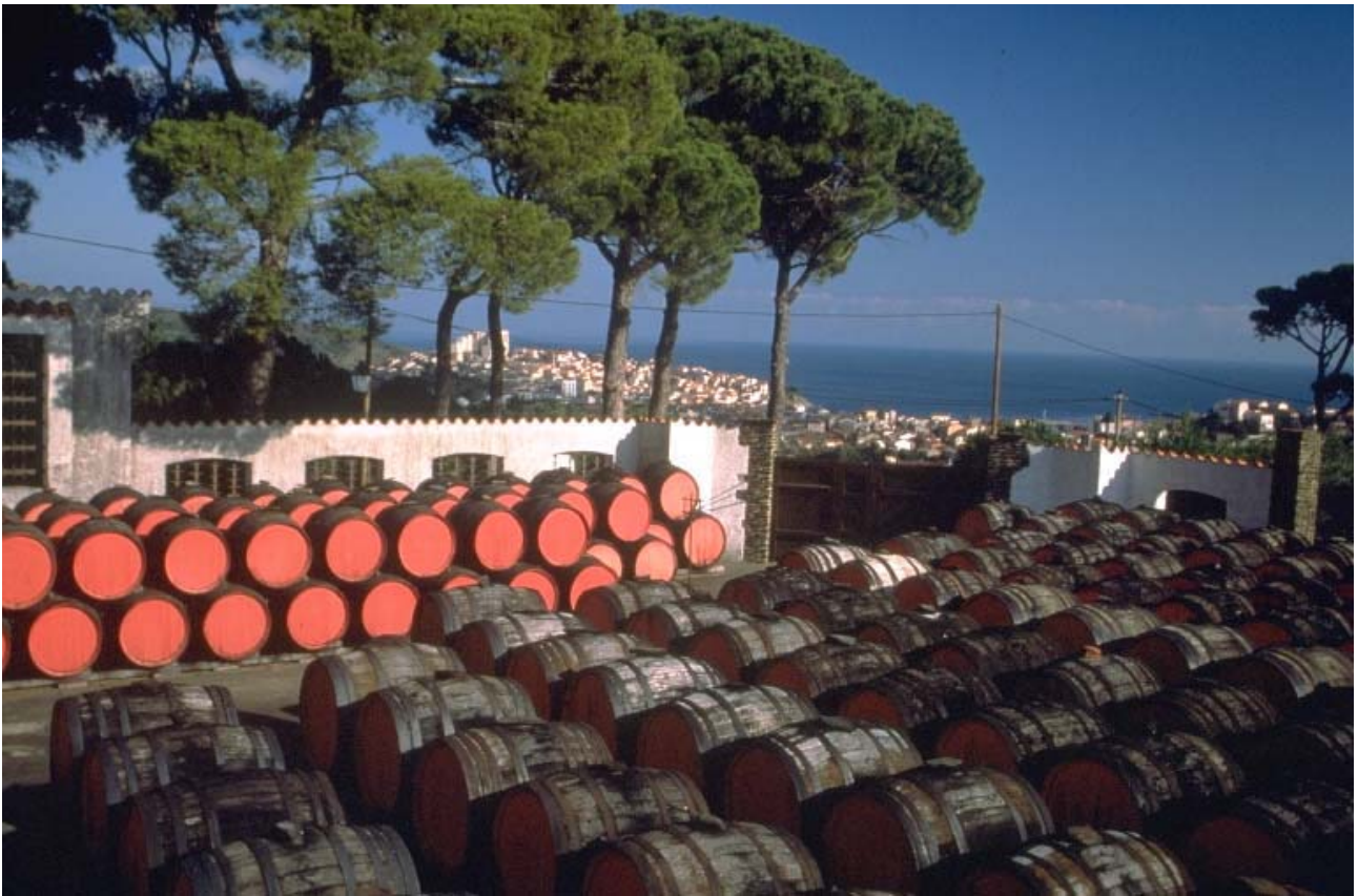
Vieillessement du vin à Banyuls sur mer

Ces dispositions permettent de définir un secteur constructible où pourraient être implantées des constructions non nécessaires aux exploitations agricoles. Les terrains concernés pourront faire l'objet d'échanges amiables entre propriétaires, voire d'une réserve foncière communale.