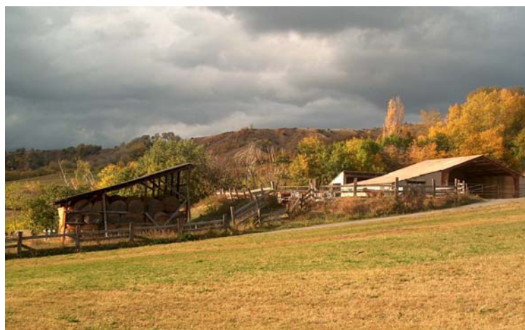
Bâtiment agricole à Llo