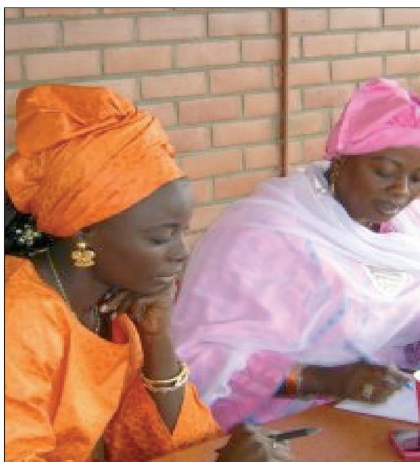
Autre groupe de stagiaires sénégalaises

relais au terme de la fabrication ou de la transformation des produits, il est essentiel d'aider les femmes à développer leur réseau relationnel et à se vendre, tant sur les marchés nationaux qu'internationaux. Les outils sont nombreux mais encore trop peu exploités à l'heure actuelle: gestion des ressources