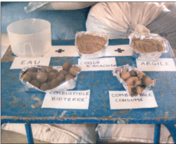
Les composants du combustible

les activités para-agricoles de N'Dem, telle que la confection et la vente de produits artisanaux exposés dans leurs galeries, permettent également aux habitants de trouver les moyens économiques de leur survie, sans épuiser davantage les ressources naturelles. Il s'agit notamment de pallier le problème de la déforestation abusive. Petit à petit, et avec toujours plus d'inventivité, N'Dem se