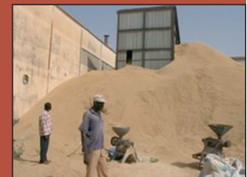
Dépôt de balles de riz à l'entrée d'une rizerie de Ross Bétio

Le départ est donné ; la motivation est bien présente. Et comment ne le serait-elle pas quand il s'agit de réduire la facture énergétique ?