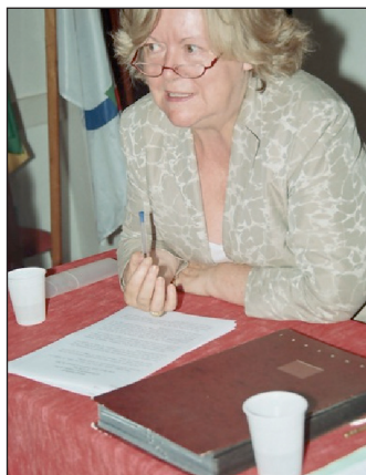
Madame Anne Marie Lizin.

Du 8 au 14 septembre 2007 s'est déroulé, au Bureau Afrique de l'Ouest de l'Agence Universitaire de la Francophonie -BAO à Dakar, un séminaire régional francophone mention Relations internationales.