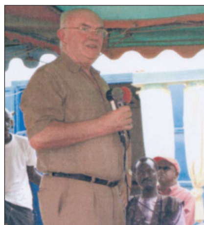
Discours de M. Pierre Hazette, Délégué Général Wallonie- Bruxelles à Dakar.

A la fois écologique et énergiquement rentable, le combustible « Bioterre » à base de matériaux récupérés renforce encore l'autonomie de ce village implanté dans la zone sahélienne.