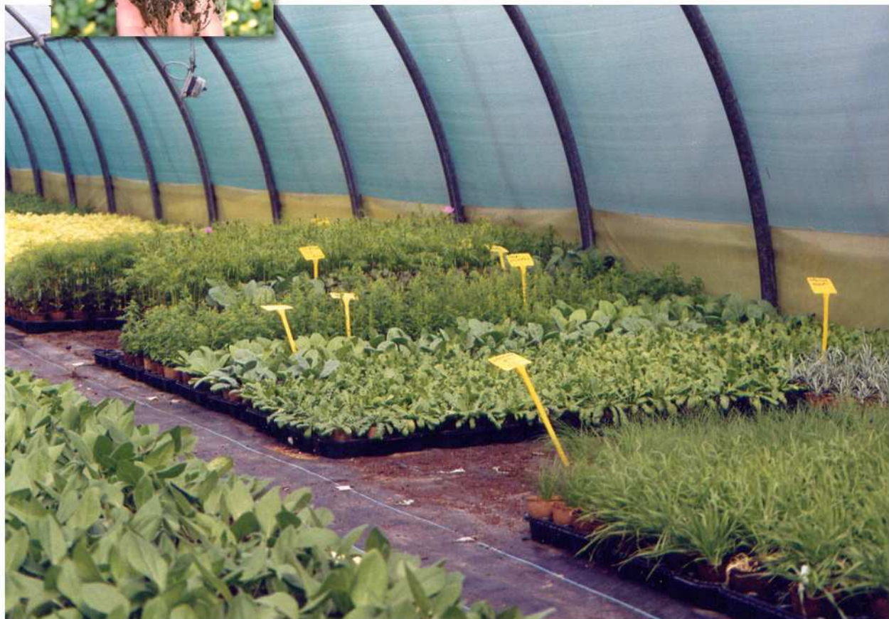
Le FERTILPOT en horticulture ornementale

C'est également une réponse originale aux besoins exprimés par les utilisateurs qui recherchent des produits "prêts à planter" respectueux de l'environnement.