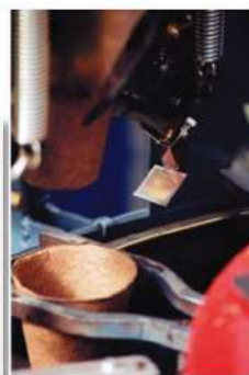
Dépilage automatique du FERTILPOT

2 – Lorsque le végétal en FERTILPOT est planté ou repoté sans enlever le pot, les bourgeons racinaires dormants mis en place lors du cernage aérien se réveillent immédiatement. Il n'y a pas de choc de transplantation. Cette différence est particulièrement sensible lorsque les conditions sont difficiles (froid, sécheresse, saison défavorable...). Enfin, la non-déformation du système racinaire assure un bon ancrage de la plante et une meilleure prospection du sol.