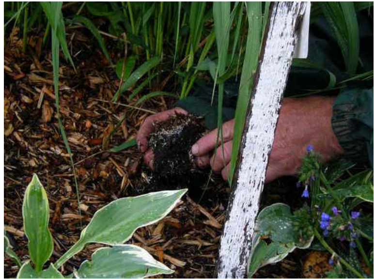
Vue des basidiomycètes dans le sol

Les basidiomycètes ( Basidiomycota ) constituent un vaste embranchement (ou division) de champignons, caractérisés par des spores formées à l'extrémité de cellules spécialisées, les basides. Ces champignons ont besoin d'air et d'humidité pour survivre. Ils ne survivent pas dans un sol à nu (sans mulch) ni en profondeur.