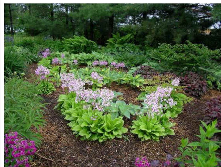
Vue du Jardin Vivaces. Tout le sol est recouvert de BRF.

Plus le diamètre de la branche est petit, meilleur sera l'effet sur le sol (tout diamètre supérieur à 7 cm est à proscrire). L'idéal est que ces rameaux ou branchages soient broyés pendant la période dormante, peu avant la poussée de sève (février/début mars). Ceci parce qu'elles contiennent de la lignine en formation, plus attaquable par les champignons et les bactéries que la lignine adulte ou mûre, telle que présente dans le tronc des arbres. Ces branches contiennent une matière azotée indispensable au développement de ces bactéries et champignons. Ces branchages, chez vous, peuvent