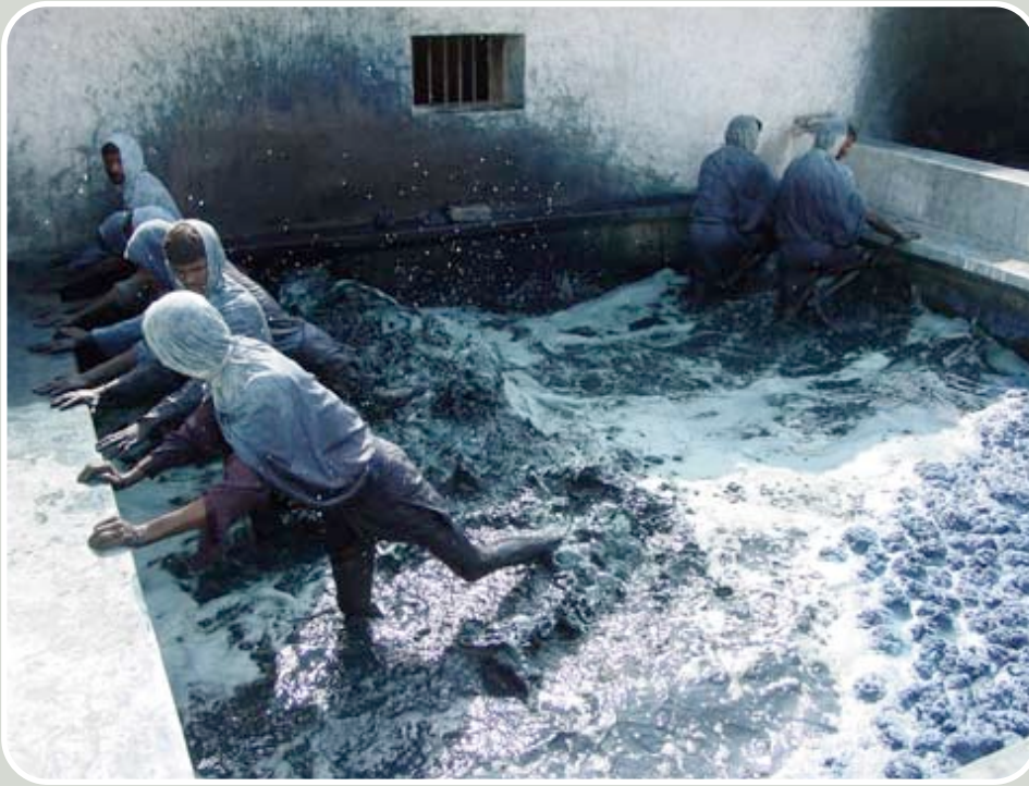
Préparation de l'indigo à Gingee en Inde.