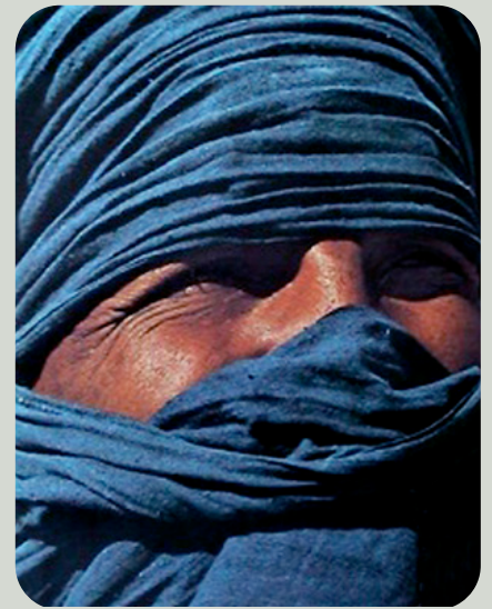
L'Afrique occidentale présente aussi un rapport particulier avec l'indigo, dans sa mythologie et ses coutumes, comme en atteste notamment l'exemple bien connu des hommes bleus, les Touaregs.