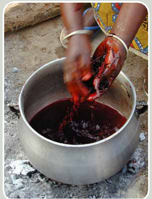
Extraction de colorant par frottement des tiges.