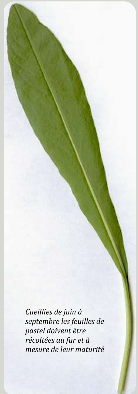
Cueillies de juin à septembre les feuilles de pastel doivent être récoltées au fur et à mesure de leur maturité

Les fruits caractéristiques de cette plante sont des siliques pendantes, vaguement elliptiques, allongées et aplaties. Elles contiennent 1 à 2 graines.