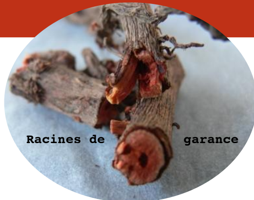
Racines de garance

Elle pousse en terrain riche et léger, floraison de mai à juillet.