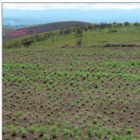
Semis en pur sur sol dégradé

En zone tropicale humide, l'implantation peut se faire durant toute l'année, en évitant cependant les périodes sèches éventuelles. Un semis tardif (entre mars et juin) n'est pas recommandé, la mise à fleur en juin ralentissant fortement sa croissance alors qu'il reste très jeune et peu développé. Après le mois de février, si les pluies sont suffisantes, il est préférable de l'implanter par bouture.