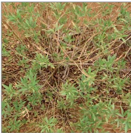
Stylosanthes sur sol pauvre (sable roux, Androy) après 10 mois sans pluie. Les tiges maintiennent les feuilles au sol

Il a également l'avantage de ne pas faire de compétition importante quand il est associé à une culture et de ne pas être une plante envahissante : même si les semences peuvent être emportées par les animaux ou l'eau, le risque qu'il devienne envahissant est très réduit.