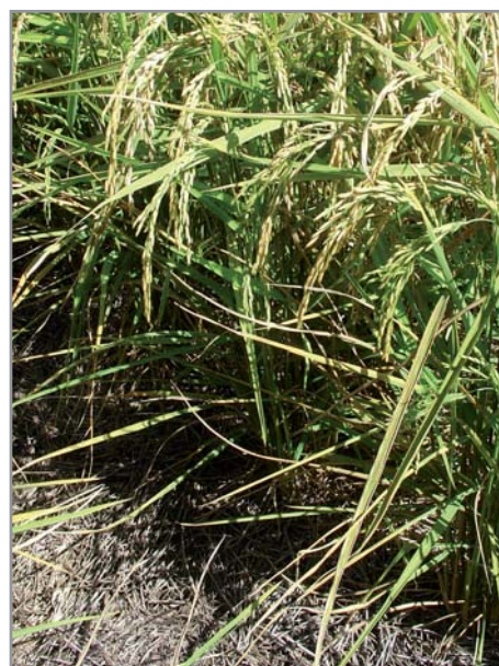
Couverture permanente du sol par les tiges ligneuses de stylosanthes

La décomposition lente des tiges de stylosanthes produites en grande quantité permet de maintenir une couverture permanente, protégeant ainsi le sol de l'érosion, améliorant l'infiltration de l'eau et réduisant fortement la pression des adventices.