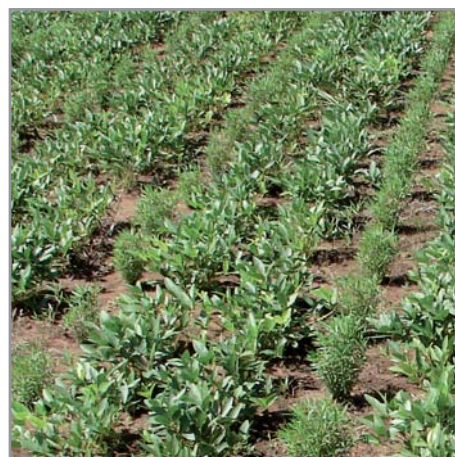
Implantation du stylosanthes en association avec du pois de terre

En culture pure il est souvent difficile de le semer tôt, les paysans préférant souvent terminer l'implantation des cultures avant de semer une plante de couverture/fourrage. Il est donc recommandé de semer dès que possible (dès les premières pluies utiles voire même en sec avant les pluies), et dans tous les cas avant :