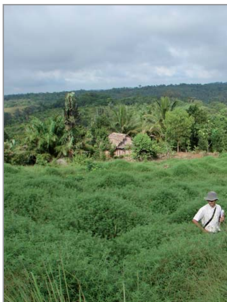
Défriche sans brûlis, Sud-Est