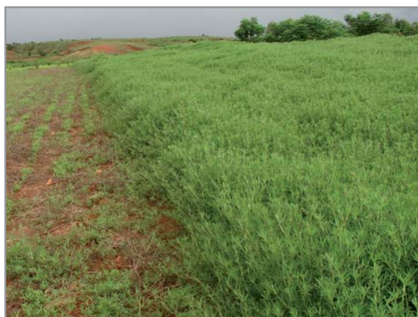
Forte production de biomasse sur sol dégradé, (à gauche : 2 mois après semis, à droite : un an après semis)

La production de semence est aisée dans la plupart des situations, en particulier dans les climats avec saison sèche. Stylosanthes guianensis est une plante autogame de jours courts. A Madagascar, en zone intertropicale, la floraison a lieu en mai - juin en général (durée du jour : 11h30). Une deuxième floraison a lieu en octobre, mais elle est souvent minime, sauf en milieu tropical humide, où elle est beaucoup plus intéressante que dans les autres milieux. Cependant, en fonction de la date de semis du stylosanthes (le semis peut être fait à différentes périodes dans ces milieux humide), il peut être nécessaire de gérer la plante de manière particulière : En cas de semis tardif, après le mois de février, la floraison en juin sur des plants très jeunes ne permet pas une production de semences intéressante et ralentit fortement la production de biomasse. Il est dans ce cas préférable de faucher le stylosanthes avant la floraison