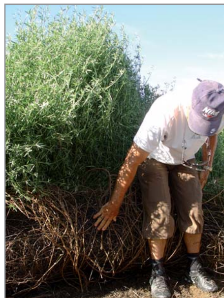
Soulever et enrouler le tapis végétal pour faucher les pivots au ras du sol

Il est préférable de couper le stylosanthes vers la fin de la saison sèche, ce qui évite le risque de reprise, et 30 à 40 jours avant la date estimée du semis de la culture suivante. En procédant ainsi, l'épais tapis végétal se tassera suffisamment pour permettre le semis dans de bonnes conditions, même dans une biomasse végétale de plus de 15-20 t/ha.