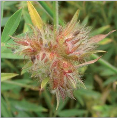
Capitules et graines de Stylosanthes guianensis

pour relancer sa croissance et attendre la floraison d'octobre pour récolter les semences.