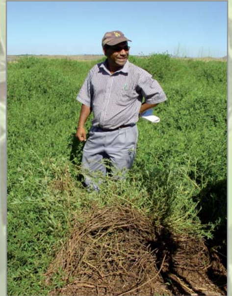
Protection du sol, contrôle des adventices