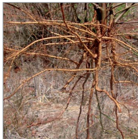
Système racinaire puissant