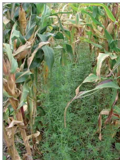
Association maïs + stylosanthes Redémarrage du stylosanthes par graines