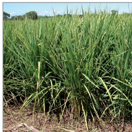
Riz pluvial (Sebota 68) sur paillage de Stylosanthes guianensis

* Si on le laisse grainer, le stylosanthes redémarre chaque année par ressemis naturel. Les systèmes à base de stylosanthes se pérennisent alors et il n'est pas nécessaire de reimplanter chaque année une couverture. Ainsi, les rotations du type [Riz + stylosanthes] - [Maïs + stylosanthes] sont particulièrement intéressantes puisqu'elles demandent un travail réduit et peuvent se conduire avec très peu d'intrants chimiques, voire sans engrais minéral.