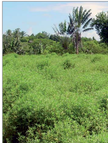
Forte production de biomasse et contrôle des adventices, Sud-Est

Stylosanthes guianensis est une légumineuse qui fixe de fortes quantités d'azote (70 à plus de 200 kg/ha/an d'azote (1)(2) ), nodule naturellement sans nécessiter d'inoculation, et est capable de recycler bases (en particulier le calcium (2) ) et oligo-éléments (B, Cu, Zn et surtout Mn, qui est souvent déficient en semis direct sous forte pluviométrie), les rendant accessibles à la culture suivante. Il permet donc d'enrichir rapidement les sols. Il est aussi capable d'extraire le phosphore de milieux qui en sont pauvres (1)(2) .