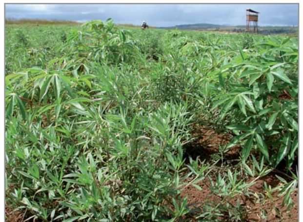
Association Manioc + Stylosanthes guianensis

Moyennement tolérant à l'ombrage, il peut cependant être utilisé en couverture vive des vergers, en le maîtrisant par fauche manuelle ou mécanisée (rotovator) sur les lignes d'arbres.