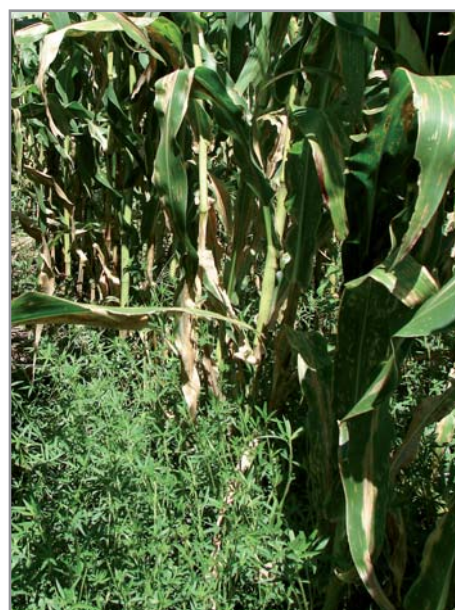
Stylosanthes guianensis, semé en même temps que le maïs