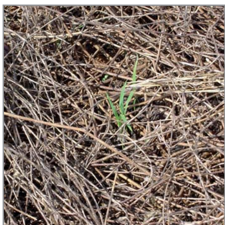
Jeune plant de riz dans une couverture épaisse de Stylosanthes guianensis . Absence d'adventices

Si l'on souhaite cultiver la parcelle alors que le développement du stylosanthes est encore insuffisant, il est possible de simplement faucher les lignes de stylosanthes (à 10-15 cm de haut environ pour ne pas risquer de le tuer) et de semer du maïs ou de planter du manioc entre ces lignes. Il faut cependant être vigilant à ce que le stylosanthes ne ré démarre pas trop vite, et le faucher de nouveau dès qu'il risque d'entrer en compétition avec la culture. En fonction de la biomasse disponible, on pourra :