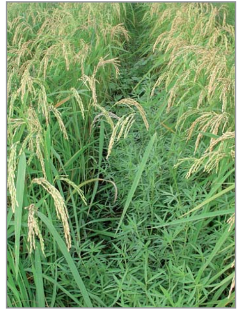
Implantation du stylosanthes en association avec du riz pluvial

Ses tiges ligneuses et ses grosses racines se minéralisent lentement, alors que les feuilles et les petites racines riches en azote (au rapport C/N bas) se minéralisent rapidement, permettant une alimentation continue des plantes cultivées sur couverture de stylosanthes.