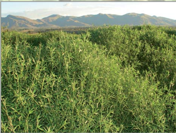
Forte production de biomasse