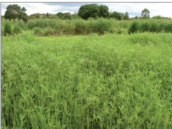
Pâturage de Stylosanthes guianensis associé au Brachiaria humidicola

Le stylosanthes supporte mal la pâture intensive. Il est préférable de le faucher et d'alimenter les animaux hors de la parcelle. La fréquence de fauche ne doit pas être trop rapide (tous les 2-3 mois), en particulier pour permettre une coupe suffisamment haute (25 cm), la coupe trop près du sol endommageant fortement la plante. On peut cependant effectuer une fauche entre 10 et 20 cm du sol durant les premiers mois pour favoriser la production de tiges (2) .