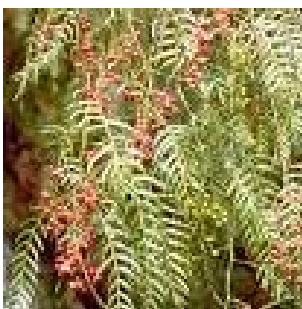
Faux poivrier (arbre)