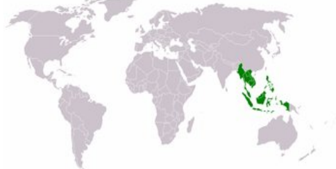
Répartition dans l'océan Indien