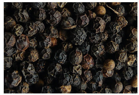
Poivre noir du Sarawak.