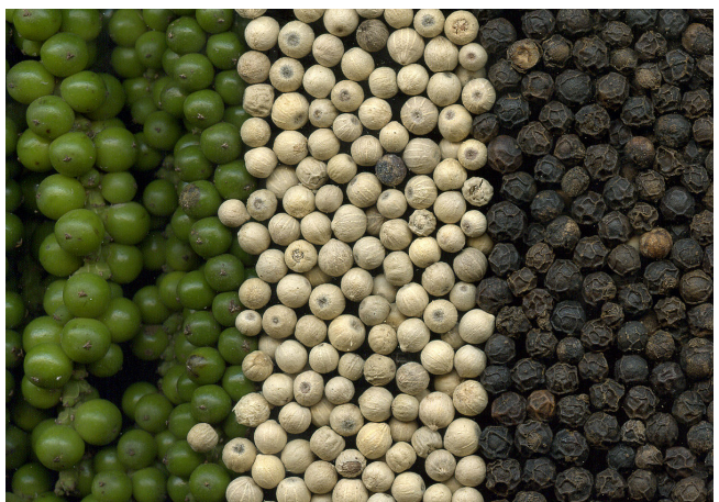
Poivre vert, blanc et noir

L'espèce Piper longum produit le poivre long, très utilisé dans l'Antiquité et au Moyen Âge, mais presque oublié de nos jours. Le Piper cubeba produit le poivre cubèbe, un grain rond à petite queue, d'où son nom de « poivre à queue ».