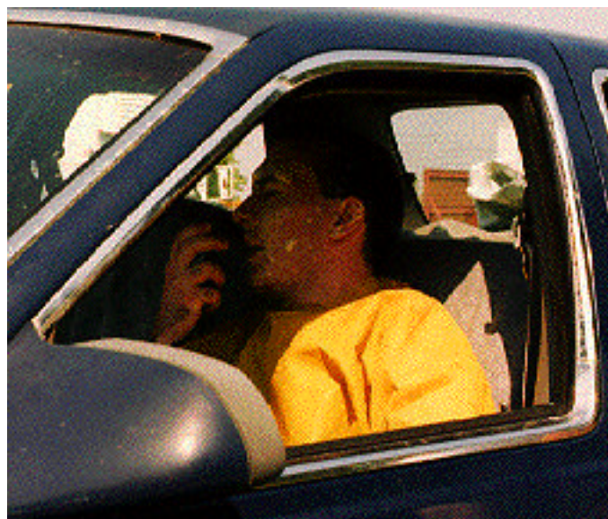
On lui demande de se réfugier dans sa voiture et d'appeler de l'aide.