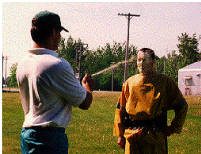
Un aspirant policier de l'Institut de police du Québec se soumet à une expérimentation.

La littérature scientifique actuelle nous apprend que le poivre de Cayenne ne semble pas altérer les fonctions respiratoires ni augmenter l'asthme. Cependant, dans un seul rapport d'autopsie, il a été suggéré que le poivre de