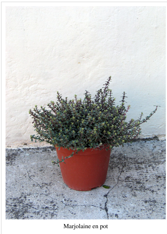
Marjolaine en pot

Plante vivace, de 60 cm de haut. Feuilles opposées, vert grisâtre, de forme ovale entière, de 1 à 2 cm de long. Petites fleurs blanches ou mauves, groupées en groupes serrés à l'aisselle des feuilles avec deux bractées en forme de cuillère.