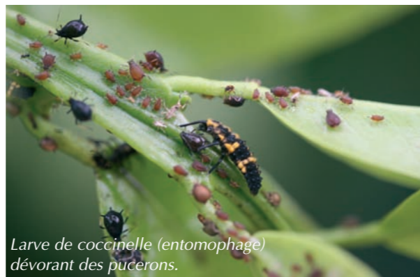
Larve de coccinelle (entomophage) dévorant des pucerons.

Les auxiliaires des cultures fruitières tropicales sont nombreux et classiquement divisés en entomophages (organismes qui se nourrissent d'insectes) et en entomopathogènes (micro-organismes causant des maladies aux insectes). Deux groupes d'entomophage se distinguent : les prédateurs (dont des insectes comme les coccinelles, les perce-oreilles ou encore des punaises ; des acariens prédateurs comme les Phytoseiidae et des araignées prédatrices) et les parasitoïdes. Ces derniers sont généralement de très petite taille et déposent leur ponte sur ou à l'intérieur du corps de l'hôte (le ravageur en l'occurrence). Après éclosion, le développement des larves se fait aux dépens de cet hôte ce qui finit par le faire mourir. Ces parasitoïdes sont souvent des micro-guêpes ( Hymenoptera ). Les entomopathogènes sont quant à eux des micro-organismes comme des champignons, des bactéries,