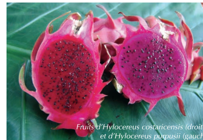
Fruits d' Hylocereus costaricensis (droite) et d' Hylocereus purpusii (gauche)

La pulpe du fruit, rafraîchissante et d'une texture proche de celle du kiwi, est le plus souvent consommée crue. Sa saveur, peu prononcée, peut être relevée par quelques gouttes de citron. La pulpe est également utilisée en jus, en sorbet et en salades de fruits. Des propriétés antioxydantes et colorantes sont reconnues aux pitahayas à chair rouge. H. undatus est la cactacée grimpante la plus répandue sous les tropiques, elle est par exemple utilisée comme porte-greffe pour d'autres cactus ornementaux. Des chercheurs malgaches ont découvert des vertus médicinales aux Hylocereus , l'extrait de la plante entière aiderait notamment à dissoudre les lithiases et à empêcher la formation.