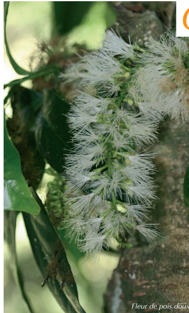
Fleur de pois doux

Originnaire de l'Amérique Centrale et des Antilles, le pois doux est un arbre de forêt étalant sa couronne en forme de parasol jusque 15 m de haut. Il sert d'ombrage aux cultures de café ou borde les allées et rues d'Amérique Centrale et du Sud. Ses feuilles sont composées de 2 paires de grands folioles elliptiques. Ses fleurs, blanches et très belles, se regroupent dans de longues inflorescences de 10 à 15 cm de long rappelant un goupillon. Elles sont prisées des abeilles. Elles donnent naissance à des gousses plates de couleur vert tendre qui ne s'ouvrent pas à maturité. Elles contiennent 6 à 10 graines noires qui ont la particularité de pouvoir germer dans la gousse. Les enfants apprécient beaucoup la pulpe blanche et sucrée qui entoure les graines. Pour l'atteindre, ils ouvrent la gousse sur sa longueur. Cette pulpe est juteuse et de saveur douceâtre. Elle est généralement consommée crue.