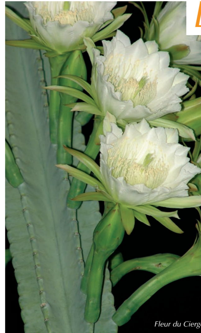
Fleur du Cierge

Le cierge est originaire du Brésil. Ce cactus est fréquemment rencontré dans toutes les contrées tropicales, mais peu de personnes savent que ce cierge peut donner des fruits comestibles. Ce fruit est en effet peu connu en dehors de son berceau d'origine, hormis en Israël où sa culture a débuté il y a quelques années. Cette plante, pouvant atteindre 15 mètres de hauteur, est ramifiée dès la base. Les tiges sont dressées et souvent pourvues d'épines. Des très grandes fleurs (20 à 25 cm de longueur) naissent des fruits de forme ovoïde et de couleur rouge-violacé. La pulpe du fruit est molle, juteuse, de couleur blanche à rosâtre et pourvue de nombreuses petites graines noires. Cette pulpe est consommée crue. Sa texture se rapproche de celle des pitahayas (page 176), sa saveur est différente, au goût d'abricot très agréable. La plupart des variétés de pomme cierge sont autostériles et seules des pollinisations croisées entre variétés peuvent assurer leur fructification. Même si la floraison est nocturne (comme celle des pitahayas, voir page 178), les abeilles, au petit matin, assureront la pollinisation. Ce cactus, très rustique et très tolérant à la sécheresse, peut être conduit en haie fruitière ; il sera maintenu à une hauteur inférieure à 2,50 m afin de faciliter les récoltes.