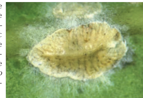
Cochenille verte parasitée par un champignon entomopathogène (Photo F. Leblanc, Cirad).

Coccophagus spp. , micro-hyménoptère parasite de cochenille (Photo F. Leblanc, Cirad)