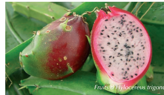
Fruits d' Hylocereus trigonus

◆ Espèces fruitières d'importance majeure