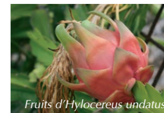
Fruits d' Hylocereus undatus