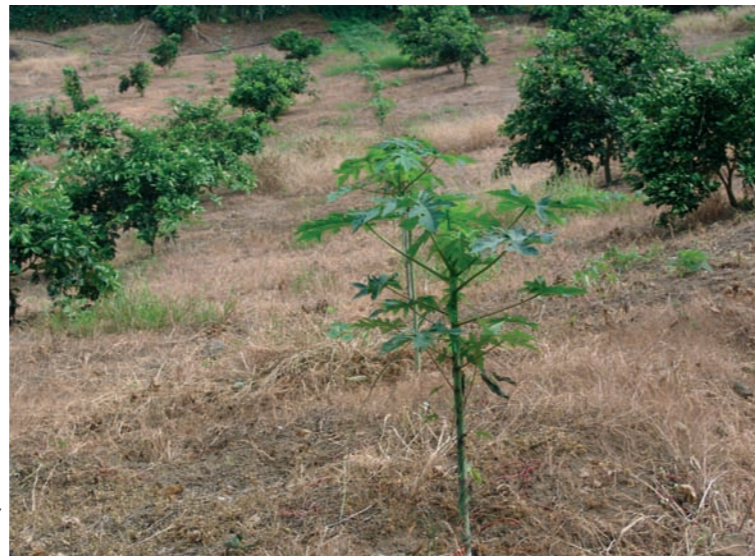
Culture intercalaire de papayers entre des agrumes. Une autre plante, annuelle (haricot, giraumon...), pourrait être également plantée afin de 'rentabiliser' l'espace et éviter aussi le désherbage chimique.