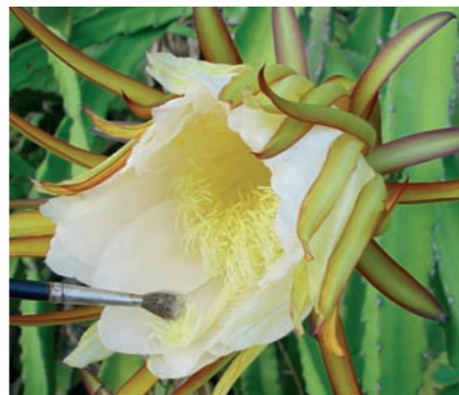
Pollinisation manuelle d' Hylocereus

Les Hylocereus fleurissent par vagues successives de floraison, H. costaricensis en compte 6 à 7 sur la saison contre 5 à 6 pour H. undatus . Trois à quatre semaines sont observées entre deux vagues de floraison. Il est de ce fait possible de rencontrer, sur une même plante et en même temps, des boutons floraux, des fleurs, des jeunes fruits ou encore même des fruits matures. La déhiscence des anthères a lieu quelques heures avant l'ouverture complète de la fleur. Les grains de pollen sont très nombreux, lourds et peu pulvérulents. La fleur s'ouvre vers 20h30, le stigmate domine alors les étamines. Les fleurs ne s'épanouissent qu'une seule fois et se referment (fécondées ou pas) pendant la matinée du lendemain de l'anthèse.