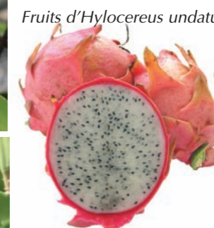
Fruits d' Hylocereus undatus