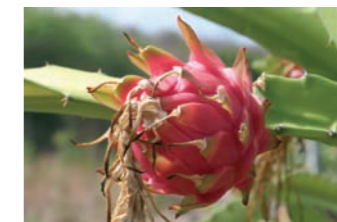
Fruit de l'hybride ( H. undatus X H. costaricensis )-obtention F. Le Bellec