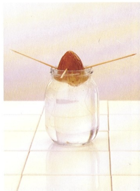
On peut aussi enraciner le noyau au-dessus d'un récipient d'eau en le faisant tenir avec trois cure-dents. Planter après enracinement.

R. Un Citrus cultivé à l'intérieur ne dépassera guère un mètre. De plus, on peut le rabattre (en mars).