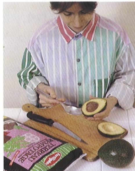
Pour planter un noyau d'avocat, ouvrir le fruit en deux et prélever à l'aide d'une cuiller. Le laver soigneusement sous l'eau froide.

La plupart des plantes tropicales exigent une atmosphère assez humide ; on effectuera donc des bassinages fréquents en été. Pendant toute la belle saison, on pourra les placer au jardin en enterrant les pots dans une plate-bande. Ainsi les plantes pourront-elles se développer et se fortifier. Rentrer en septembre.