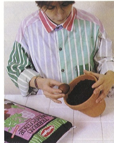
Planter le noyau, la pointe en haut, dans un petit pot de compost à semis (ou de terreau de feuilles). La pointe doit dépasser légèrement. Maintenir humide.