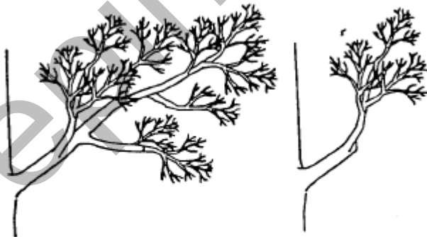
Renouvellement de branches fruitières