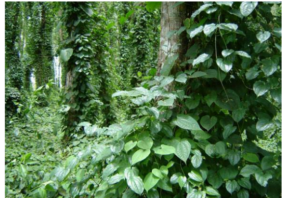
Photo 9 : De nombreuses espèces végétales et animales qui n'étaient présentes que dans les îlots forestiers se retrouvent aujourd'hui dans la majorité des parcelles. Ceci est le cas, par exemple pour les ignames sauvages

Bien qu'il n'y ait pas eu de mesure scientifique de l'évolution de la biodiversité, la perception des agrisylviculteurs et de la plupart des visiteurs est qu'un écosystème forestier se reconstitue assez rapidement sur le périmètre du projet, en lieu et place de l'ancien écosystème de savane. De nombreuses espèces végétales et animales qui n'étaient présentes que dans les îlots forestiers se retrouvent aujourd'hui dans la majorité des parcelles. Ceci est le cas, par exemple pour les ignames sauvages (Photo 9) et pour de nombreuses autres lianes et espèces arborées pionnières comme Anthocleista schweinfurthii . Ceci incite les habitants à y développer des pratiques de cueillette (jeunes pousses (Photo 10), champignons, chenilles, tubercules, etc.) et de chasse (rongeurs, reptiles, céphalophes, etc.), autrefois limitées aux zones forestières.