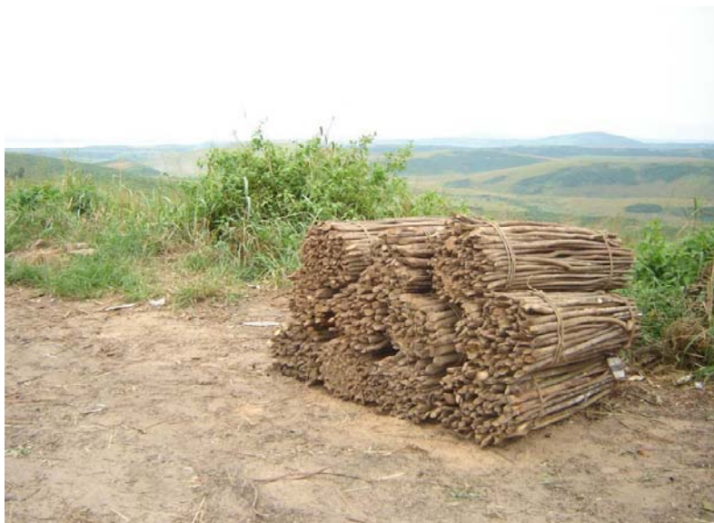
Photo 11 : La sciure et les dosses de bois de scierie, les fagots de perchettes de bois provenant de la périphérie de la ville

provenant de la périphérie de la ville (Photo 11) et divers déchets sont aussi récupérés. Plusieurs boulangers se fournissent directement en rondins de bois par leur propre circuit. Il est donc probable que Mampu assure plutôt de l'ordre de 5 à 10 % de la couverture des besoins en charbon de bois de la ville, ce qui est remarquable, si on considère que ses 100 km 2 ne couvrent que 0,3 % du demi-cercle de 150 km de rayon, qui constitue le bassin d'approvisionnement de Kinshasa.