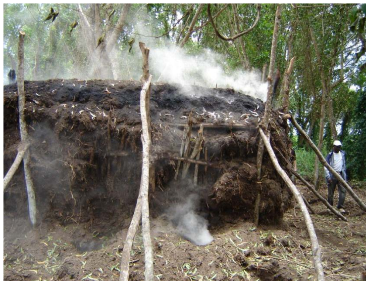
Photo 7 : Les techniques de carbonisation sont de mieux en mieux maîtrisées par les agrisylviculteurs de Mampu

Les techniques de carbonisation sont de mieux en mieux maîtrisées par les agrisylviculteurs de Mampu. Une meule de 30 stères (4 x 3 x 2,5 m), soit environ 24 T de bois sec à l'air, donne en moyenne 80 à 90 sacs de 60 kg, soit 5,1 T, ce qui correspond à un rendement légèrement supérieur à 20% du poids sec à l'air ( Photo 7 ). Ce rendement est satisfaisant par rapport aux rendements maximaux que l'on trouve dans la littérature pour la carbonisation en meule (23 % d'après Briane et al, 1985) et les accidents (incendie de la meule, brûlures des charbonniers) se font heureusement de plus en plus rares.