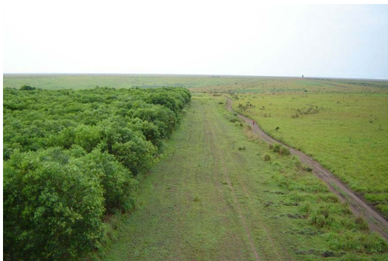
Photo 4 : Entre 1987 et 1993, la société HVA a boisé environ 8 000 ha de savane dégradée

Entre 1987 et 1993, la société HVA a boisé 7.262 ha de savane dégradée ( Photo 4 ), principalement à l'aide d' Acacia auriculiformis (plus de 95% de la surface plantée).