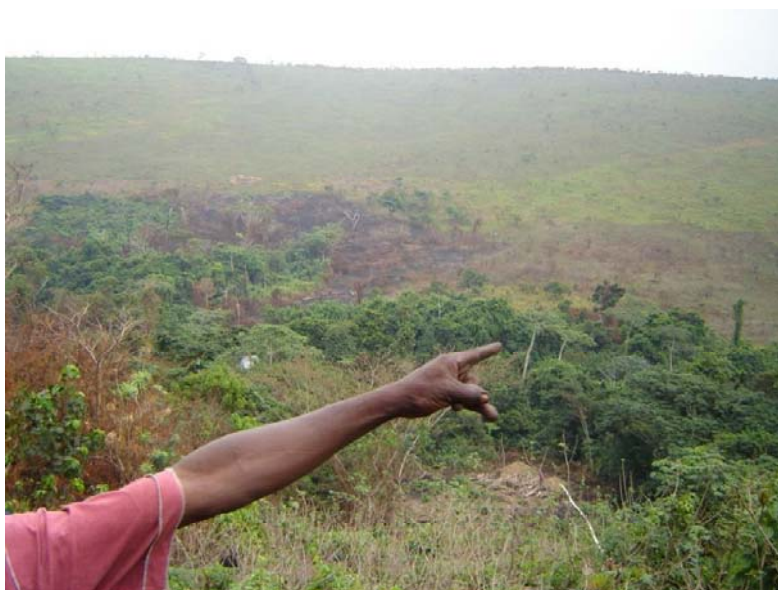
Photo 3 : Les flancs des vallées du plateau Batéké portaient autrefois des forêts denses aujourd'hui plus ou moins dégradées par l'agriculture itinérante

Les activités économiques sur le Plateau sont essentiellement orientées vers l'agriculture itinérante. L'infrastructure routière y est peu développée.